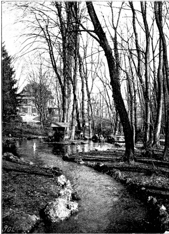
Partie im zoologischen Garten in Basel.

Sehen wir uns den zoologischen Garten nun in seiner heutigen Gestalt an, nachdem wir als fremder Besucher an der Kasse unser Eintrittsbillet à 50 Cts. gelöst haben. An der schmucken, an allen Fenstern mit blühenden Pflanzen gezierten Direktorwohnung vorüber wenden wir uns rechts, wo zuerst ein von zehn Bierhändlern bewohnter Affenkäfig unsere Aufmerksamkeit fesselt und zahlreiche alte und junge Kinder anlockt. Unermüdetlich ist aber auch die ruchlose Bande da hinter dem Gitter im Erfinden von Neckereien und Unarten, mit denen sie ihr Publikum unterhält. Während der kleine Kapuzineraffe hübsch manierlich irgend einen Leckerbissen aus