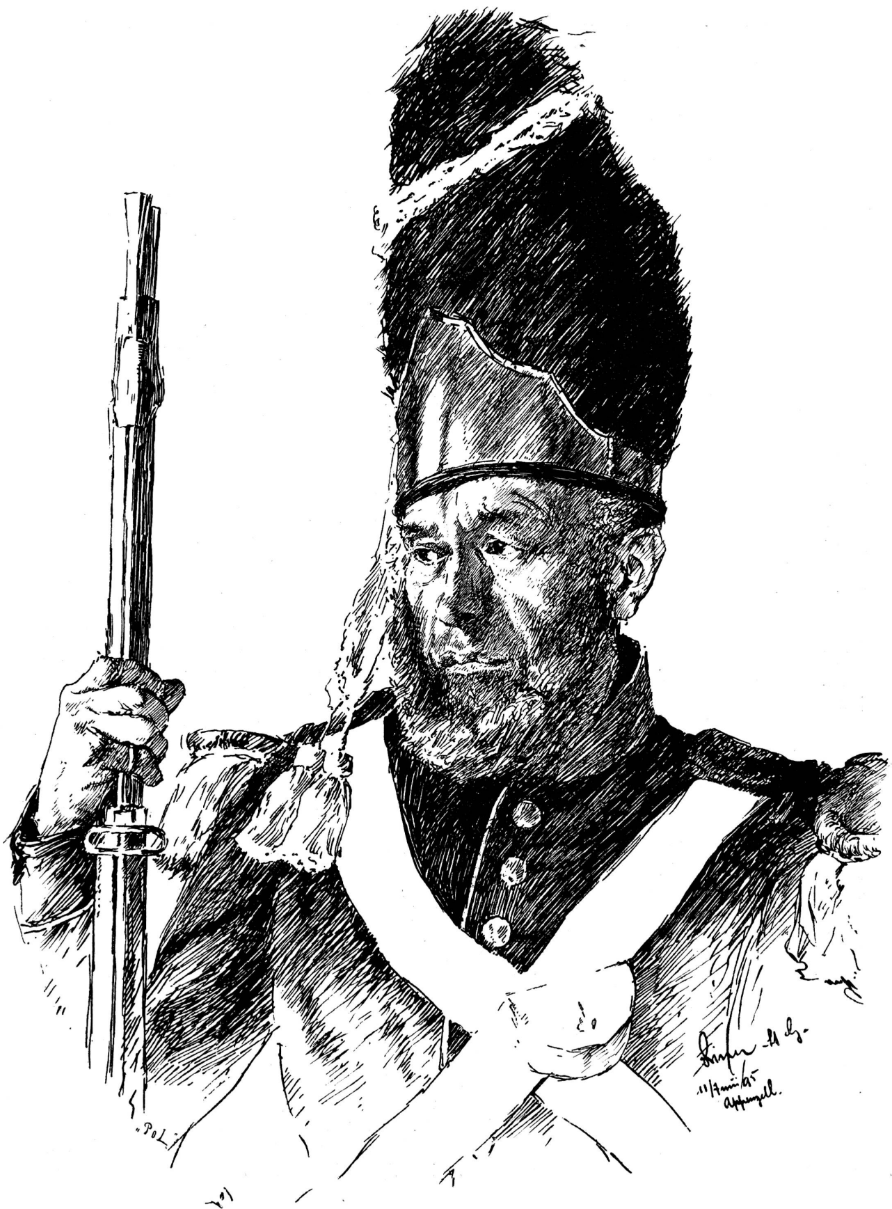
Grenadier von der Fronleichnam-Procession in Appenzell. Studie von Karl Liner, St. Gallen.