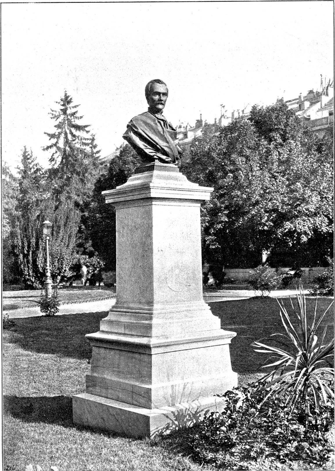
Das Calame-Denkmal in Genf.