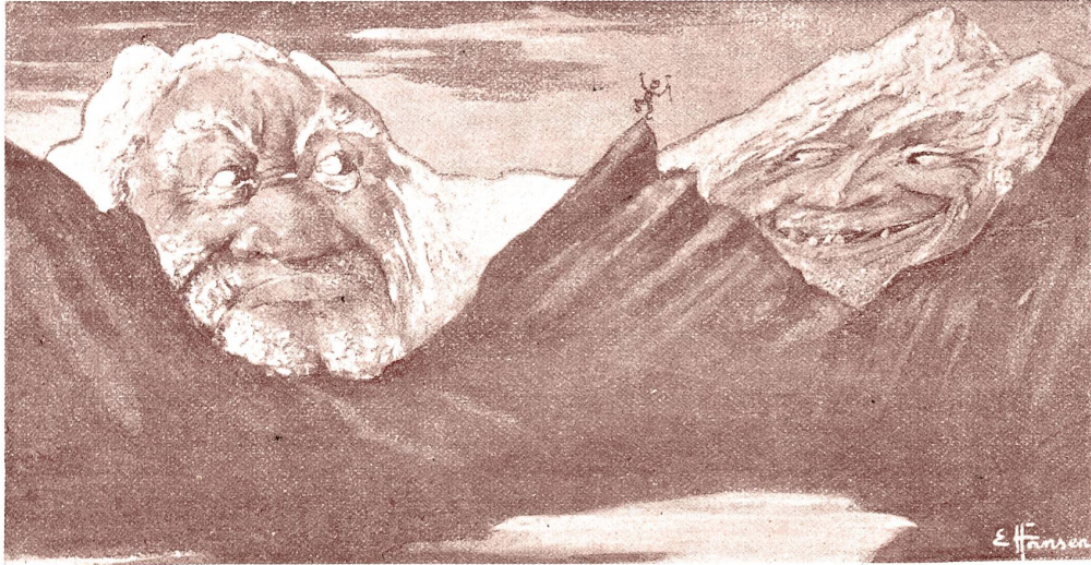
Mitmann und Papa Säntis. — Postkarte von E. Hansen, St. Gallen.