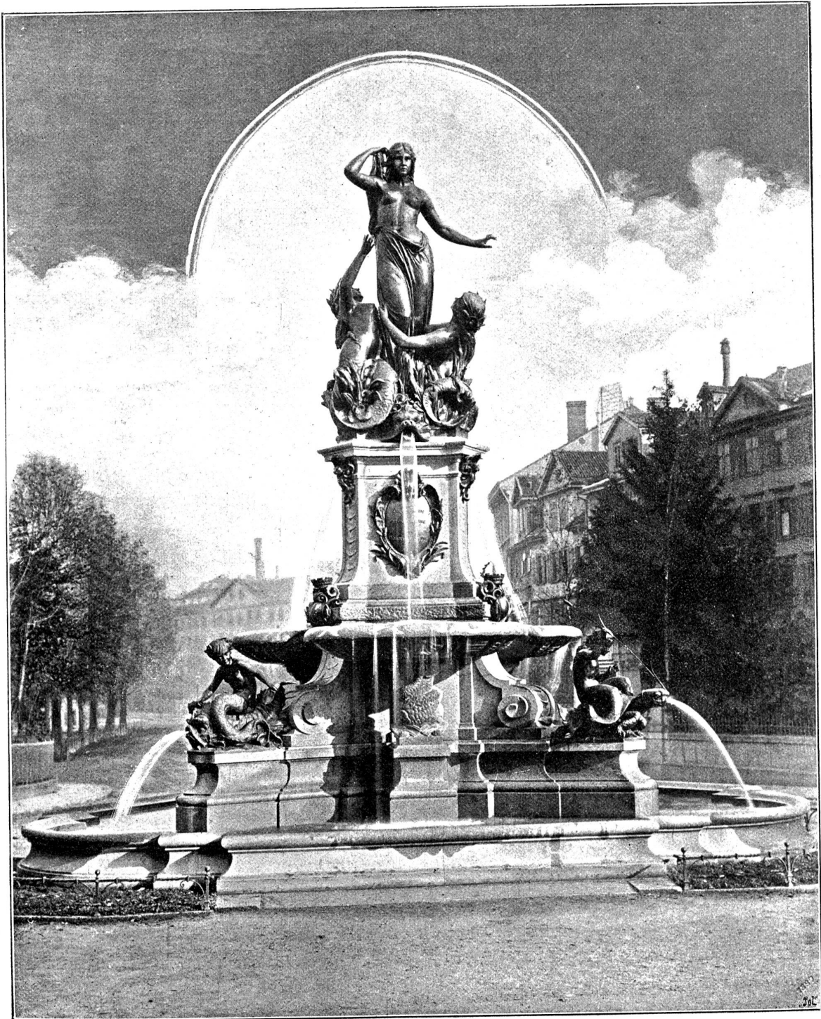
Der Broderbrunnen in St. Gallen, von H. Koch.

rötliche Grau des Granites erreicht wurde. Die Granitarbeiten von J. Hertsch in Rheineck, und die galvanoplastischen Bronzefiguren, von der Geißlinger Kunstanstalt ausgeführt, sind tadellos, und noch Eines sei betont: der Künstler ist mit seiner Schluß-