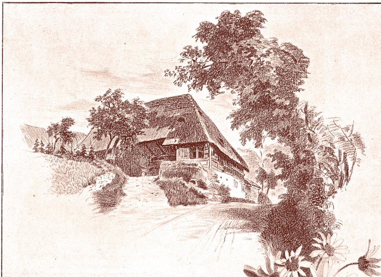
Das Geburtshaus Jacob Freys im Oberdorf zu Gontenschwil (Aargau). Für „Die Schweiz“ gezeichnet von Otokar Kodym, Lägerwilen (1897).

Die Jahre 1863—1868 schildert der nachfolgende Abschnitt aus seiner Biographie, welche im fünften und letzten Bande seiner im Erscheinen begriffenen „Gesammelten Erzählungen“ veröffentlicht werden soll: