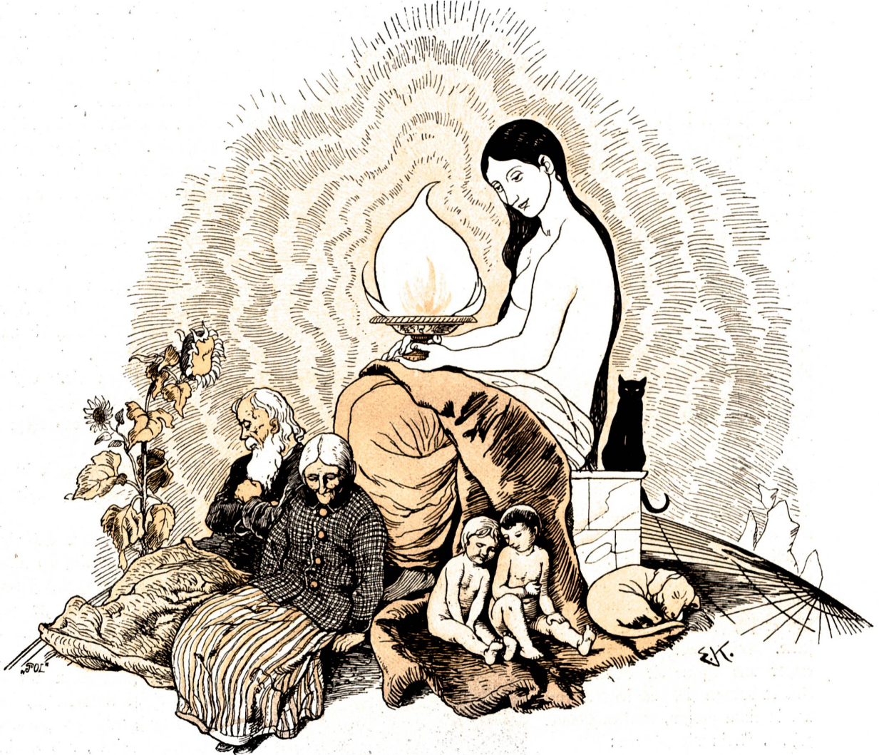
Die Wärme. Von E. Kretzschmar, (Zügerwellen) München.

Die Flasche sah zierlich aus einem Fliederbusch heraus, der Nest der Blumen prangte als üppiges Bouquet auf dem runden Tisch. Und zuletzt zerpfückte Hans eine Anzahl Rosen und streute die Blätter um sich her, wie ein Sämann, der Korn säet. Ueberall, auf den Dielen, auf Stühlen und Tischen, auf dem Sofa und der Bettdecke, selbst in den Falten der Vorhänge lagen und