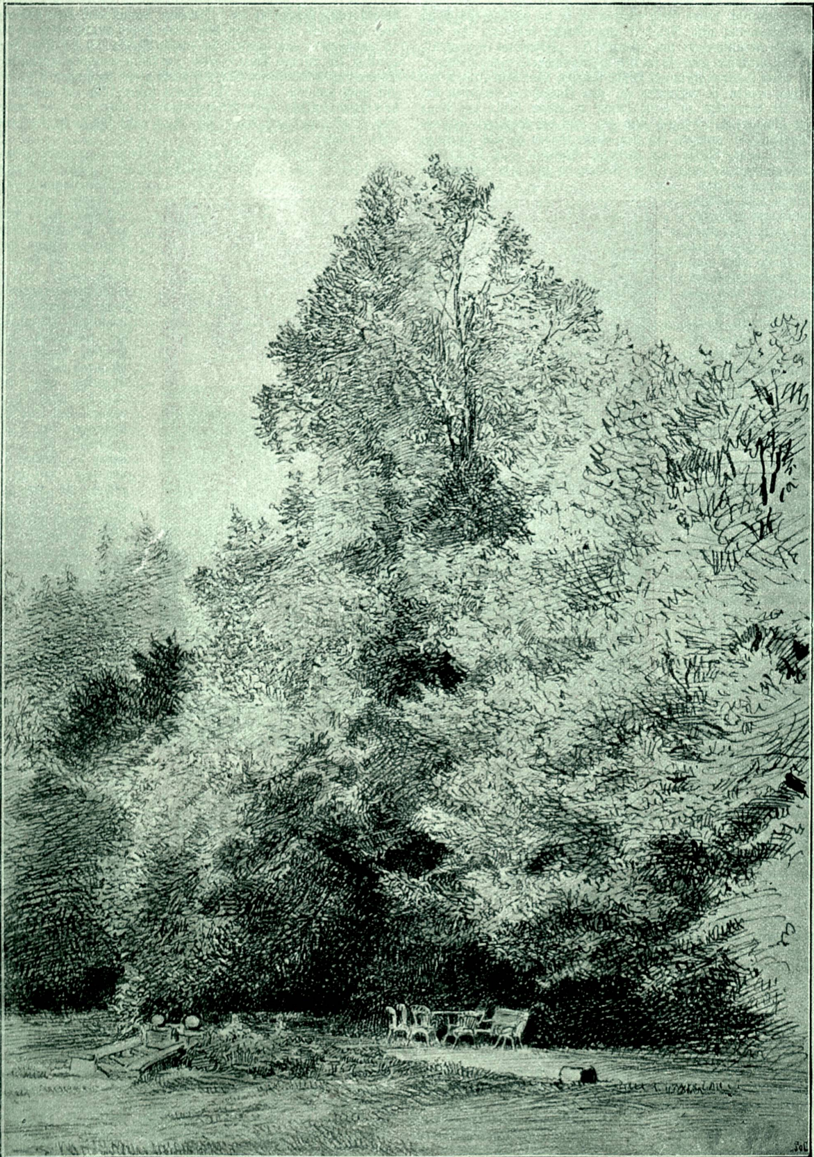
Im Park der Villa Rappard, Interlaken. — Nach Federzeichnung von Clara von Rappard.