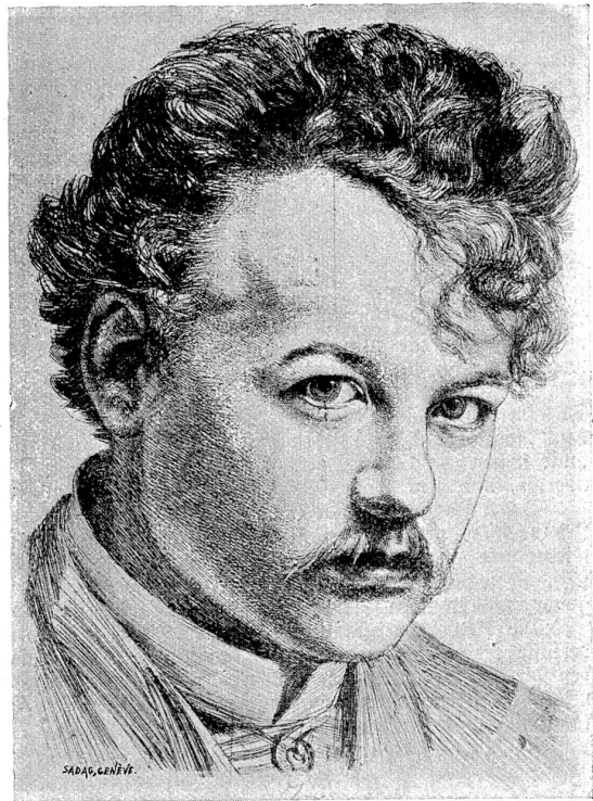
Selbstporträt Karl Staufers. Nach einer Radierung.

Eine grüne Wiese. Und in der grünen, sonnenbeschienenen Wiese zwei große, farbige Flecken, ein roter und ein blauer. Die Flecken bewegen sich. Sie werfen blaue Schatten, die langgestreckt über die Wiese laufen. Jetzt nähern sie sich. Die zwei Flecken verwandeln sich in zwei kleine Kinder. Zwei winzige runde Geschöpfchen. Sie haben beide hellblondes Kraushaar und weit offene blaue Augen. Sie halten sich an den dicken Händchen und zotteln eifrig vorwärts. Aber die Sache ist nicht leicht. Bald liegt das eine, bald das andere auf der