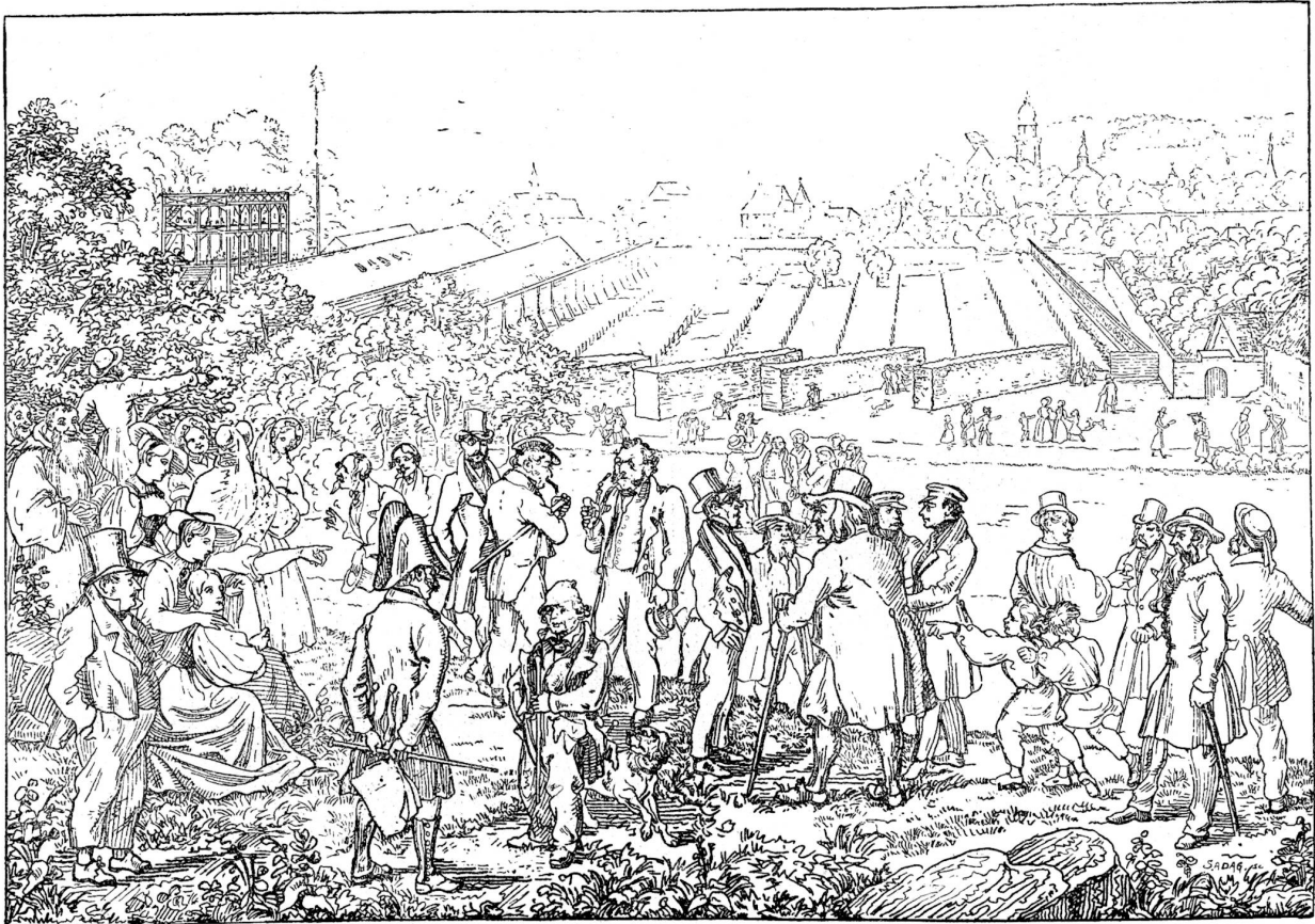
Eidgenössisches Freischießen in Solothurn (1840). Nach Distel.

Erde. Die runden nackten Beinchen zappeln über dem hohen Niedgras. Dann bleibt das zweite stehen, läßt das Mäulchen