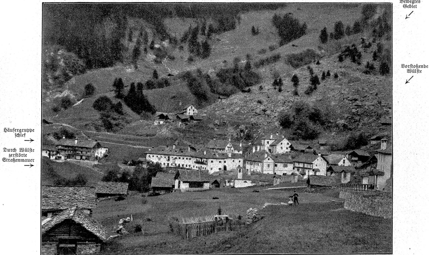
1. Mittlerer Teil von Campo, von P. 1316 gesehen (von SO.): Alles in langsamem Vorschleiben.

nachdem die Gemeinde 1852 einen Wald auf der Alp di Quadrella verkauft und die Erlaubnis erteilt hatte, das Holz durch die Novana zu flößen. Die Unternehmer errichteten drei große Barrièren, um den Fluß zu stauen; dann wurde das Holz jeweilen durch den gewaltigen Wasserfall thalabwärts gejagt. Die Folge des Holzflößens war, daß im Zeitraum von 40 Jahren sich die Novana gerade beim Dorfe um 100 m vertiefte, daß sie enorme Geschiebemassen in die Maggia hinauswarf und daß dadurch das Delta der Maggia außerordentlich vergrößert wurde. Allerdings wurde schon 1859 das Flößen