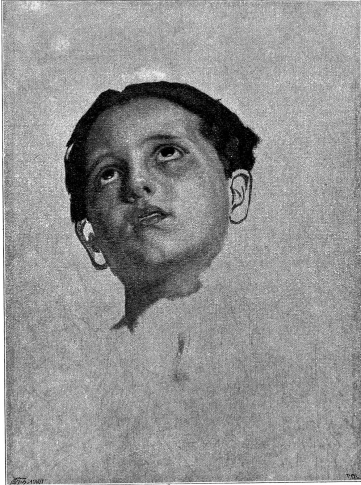
Studienkopf für den „Frühling“.

Viele der Spukgeschichten, die Peterli erzählen gehört, hatten Beziehung zu diesem Lorzentobel. Da war vor Jahren einer auf ganz unerklärliche Weise umgekommen, ein anderer hatte keine gesunde Stunde mehr gehabt nach den schrecklichen Dingen, die er dort erlebt. . . Daß auch er dem einen oder andern dieser Schicksale