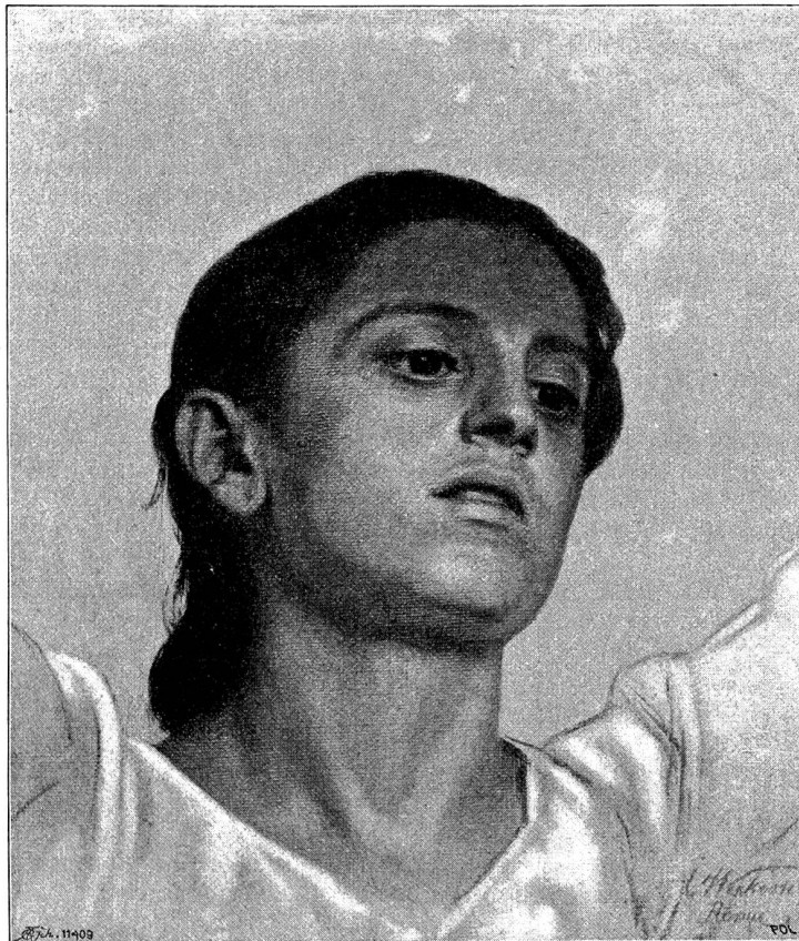
Studienkopf von F. A. Wecker (Winterthur) für den „Herbst“. Allegorische Figur für eine Veranda des Hrn. Köstli-Seiger in La Tour de Peilz bei Vevey. (Die Studie ist im Besitze des Hrn. Dr. Imhoof-Blumer in Winterthur).

„Ich will ja schon gehen!“ sagte Peterli weinerlich,