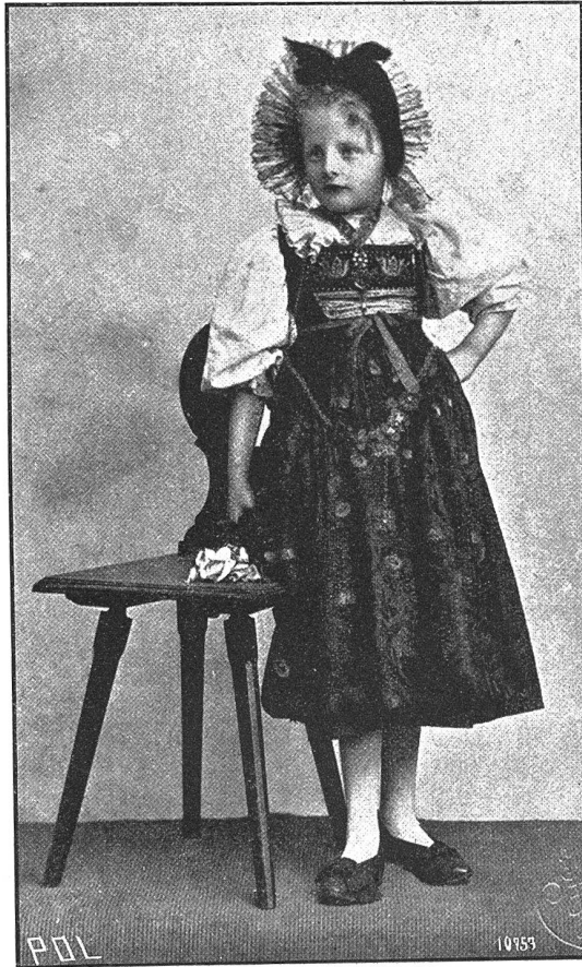
Kindertracht aus dem Freiamt. Nach einem im Schweiz. Landesmuseum befindlichen vollständigen Originalkostüm.

Zur Sommerszeit balancierte auf dem Kopfe der große Strohhut, als eigenes Landesprodukt, dessen Fabrikation schon in der zweiten Hälfte des vorigen Jahrhunderts im Freiamt große Ausdehnung annahm und sich von da auch nach den benachbarten Gebieten des Kantons Luzern und bis ins Entlebuch hinein verpflanzte. Heute hat sich bekanntlich diese Industrie