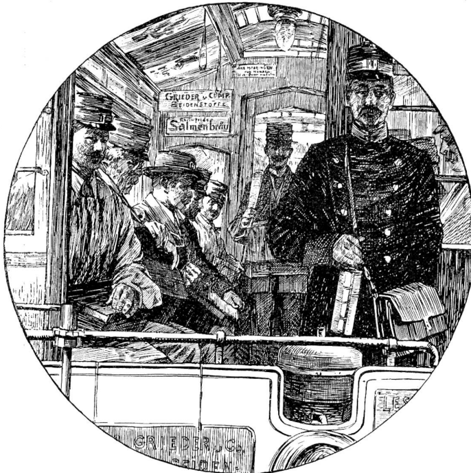
Auf dem Weg nach Oberstrah und Zuntern. (Zentrale Zürichbergbahn).

Täglich sind 60 bis 90,000 Briefe und Druckfachen an ihre Adressen zu befördern. Welch eine Arbeit haben damit unsere Postbeamten zu bewältigen, und da sind wir noch ungehalten, wenn sich dann und wann ein Brieflein oder ein Zeitungsblatt verschiebt und einige Stunden verspätet in unsere Hände kommt.