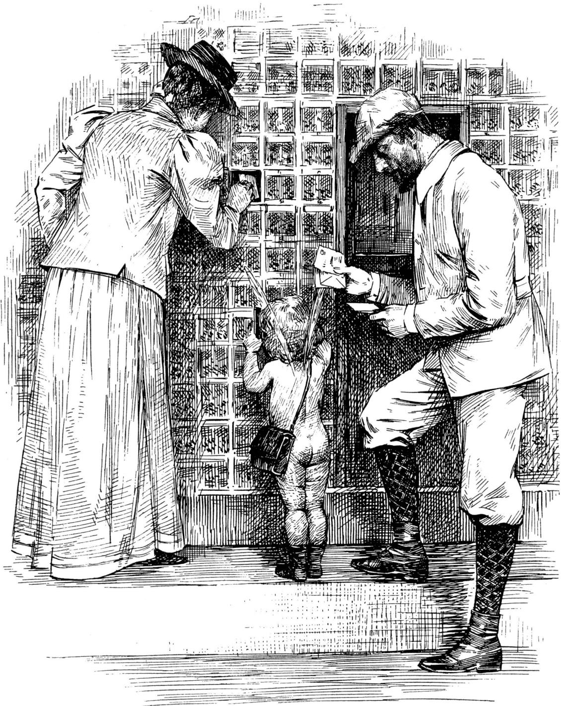
Der amerikanische Briefschalter im neuen Postgebäude in Zürich.

Originalzeichnung von Hans Meyer-Cassel.