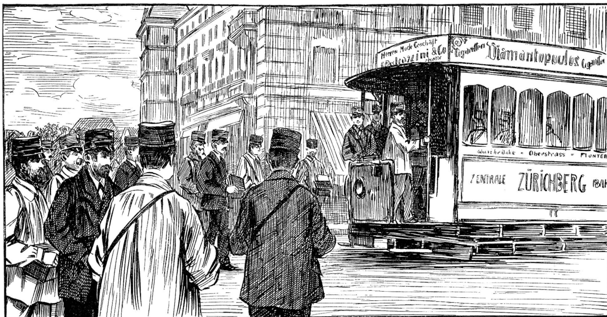
Beförderung der Briefträger durch die elektrische Straßenbahn. (Weim Hotel Bellevue).

Büreau hat seinen Auspacktisch, welcher mit seiner umrandeten Platte dem Bett einer Weinpresse ähnelt und auf den die Säcke entleert werden. Von hier kommen die Briefschaften auf den Stempeltisch, und auf dem Sortiertisch endlich wird das berghoch sich aufschichtende Material mit Sorgfalt sortiert. Im Transitbüro der Briefexpedition geschieht dies nach Routen. Für jede von Zürich abzweigende Postroute steht hier ein Gestell mit einer größeren oder kleineren Zahl von Fächern, jedes den Namen einer der Hauptstationen jener Route tragend. Mit geschärfter Ortskenntnis und großer Gelenkigkeit befördern die Beamten jedes Transitstück in das richtige Fach, und was sich durch die Distribution überall angeammelt hat, wird rasch zusammengebunden und in die bereithangenden Säcke wieder verpackt, damit der nächste Postzug es seinem Bestimmungsort zuführe.