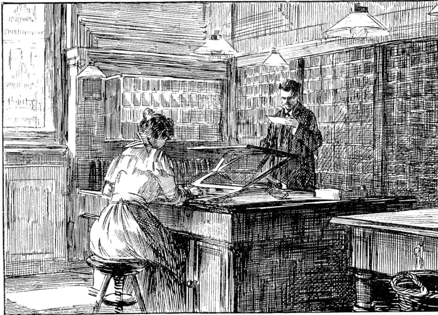
Amerikanischer Briefschalter. (Innen-Ansicht).

kehr's aus aller Herren Ländern, der sich hier staut, haben sich ganze Ballen von Zeitungen aufgehäuft, die wohlfeile Wochenlektüre des Volkes. Die ganze Nacht durch blieben die weiten, hohen Säle des neuen Postgebäudes erhell't; denn bis zur frühen Morgenstunde hatten Beamte den Nachtdienst und sortierten geschäftig den Inhalt der Säcke.