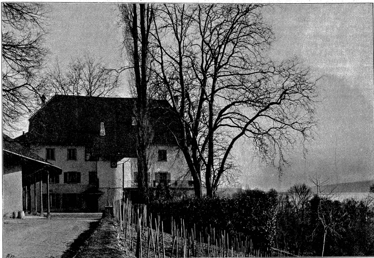
Die Kaltwasser-Heilanstalt Brestenberg.

berenden; und eine ganze Reihe dieser lyrischen Sammlung ist sicherlich in Brestenberg entworfen oder vollendet worden.