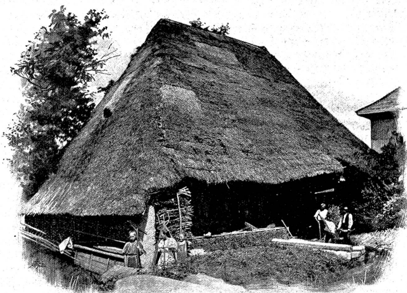
Altes Bauernhaus in Seon. 32

(1810—1890). Er war ein Lyriker aus der Schule der Hölty, Salis-Seewis und K. K. Tanner, der sich durch stimmungsvolle Gedichte auf landschaftlichem Hintergrund auszeichnete, wobei es ihm allerdings selten gelang, das lyrische Motiv von beeinträchtigendem Nebenwerk frei zu halten.