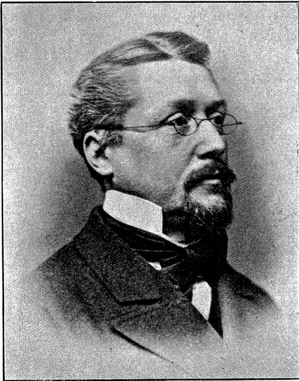
Joz. Viktor Scheffel.

sees. Unweit davon steht auf einer sanft aus der blauen Flut tauchenden Halbe die Wasserheilanstalt Brestenberg. Es ist ein schöner Fleck Erde; denn nicht nur ragen südwärts über dem schimmernden Seespiegel und den jenseitigen Anhöhen die Borberge mit Nigi und Pilatus und dahinter die Silberfirnen empor, während vom Norden der ernste Jura herüberblickt, das Umgelände selbst ist überaus anmutig, mit Gartenanlagen geschmückt, sonnig, vor Nord- und Ostwinden geschützt und trägt an seinen Hängen einen feinen, würzigen Wein. Dazu die Stille und Einsamkeit, die träumerische Ruhe über Flut und Gestad.