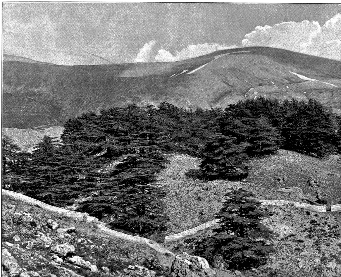
Die Cederngruppe im Libanon.