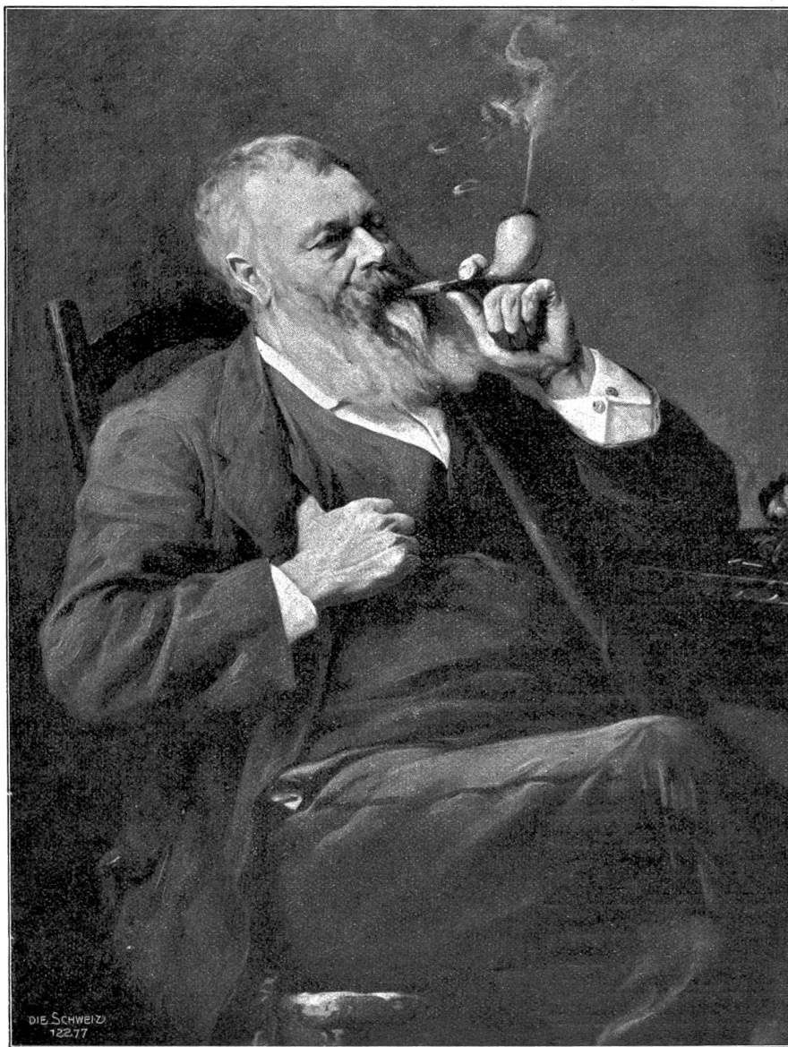
Der Raucher. Gemälde von Baud-Bovy (1878).

„Die Seemöve“* gemalt hatte, Paris für immer, richtete sich in Aeschi ein Bauernhaus* ein und wohnte fortan, geachtet und verehrt, unter den Landleuten. Sobald sein neues Heim vollständig ausgestattet war, stieg er auf den Dürrenberg, um an Ort und Stelle die „Salzverteilung“ zu vollenden. Den Winter verbrachte er in Aeschi mit Vorbereitungen für die Sommerausfahrt und mit dem Uebermalen seiner Landschaften;