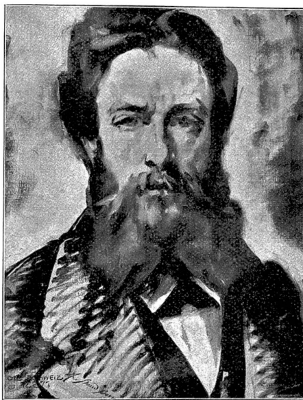
Baud-Bovy im dreißigsten Lebensjahre. Selbstporträt im Besitze der Witwe.