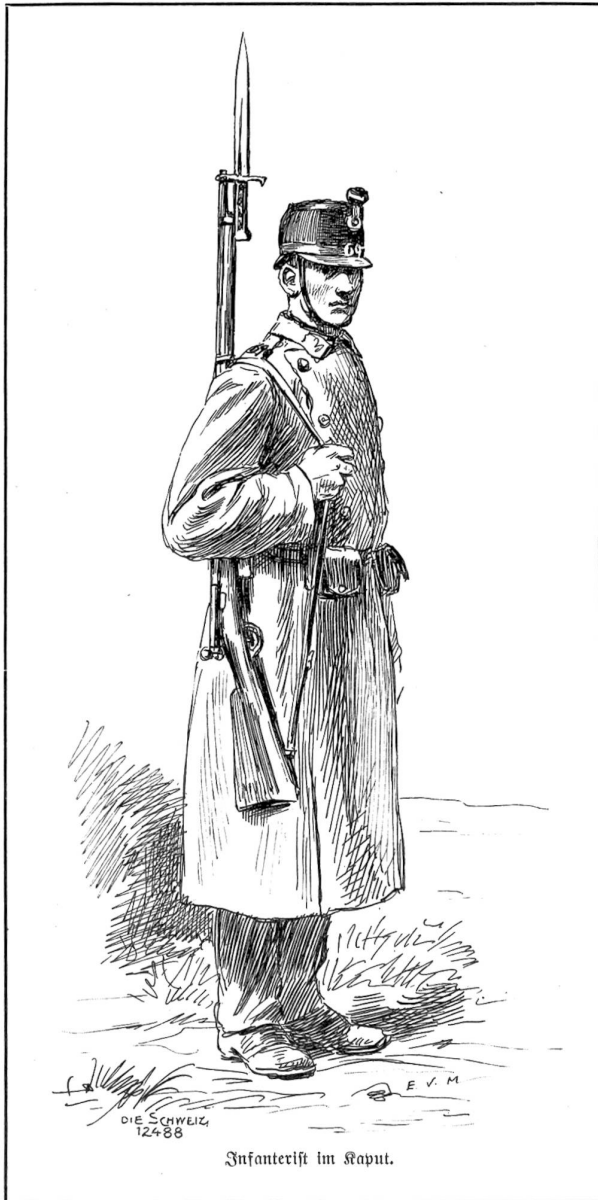
Infanterist im Kaput.

den Namen desselben, noch auf die Straße. — Laßt uns sehen, welche Straße schlugen Sie ein, als Sie den Bahnhof verließen? — Ich wählte die und die Straße, gelangte auf einen Platz, und wandte mich links. — Nun nannten sie mir verschiedene Restaurationen, ihre Aushängeschilder, irgend eine Eigentümlichkeit dieser Lokale; nichts paßte. — Und doch . . . eine derselben muß es sein; welche denn? Und sie besprachen sich darüber, es konnte die eine, es konnte die andere sein; vielleicht entsinne ich mich irgend eines Umstandes nicht. — Sind Sie ganz sicher, links gegangen zu sein? — Sehr sicher. — Und wie lange sind Sie ungefähr gegangen? Sah das Wirtshaus vornen ungefähr so und so aus? Sie sind in einen großen Saal im ersten Stocke hinaufgestiegen, haben Sie gesagt? — Ja, aber meine Angaben stimmten nicht. Sie mühten sich ab, wie an einem Rebus. Sie wollten um jeden Preis die Sache herauskriegen. Vielleicht haben wir uns über den Ausgangspunkt nicht verstanden. — Wie war aber der Platz, von dem Sie ausgegangen sind? Gernern Sie sich an etwas Besonderes? — Und das Gespräch fuhr in dieser Weise ohne Erfolg fort, zu ihrem sichtlichen Verdrusse. — Oh, schließlich — sagte Verne, — wenn Sie ihn sehen, so würden Sie ihn wiedererkennen, nicht wahr? — Ohne Zweifel. — Nun denn,