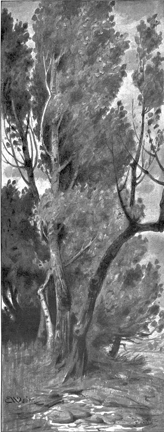
Originalzeichnung von E. Weber, Engstringen.

„Das ist die Geschichte, die ich Ihnen schuldig zu sein glaube!“ sagte der alte Pfarrer, sich erhebend.