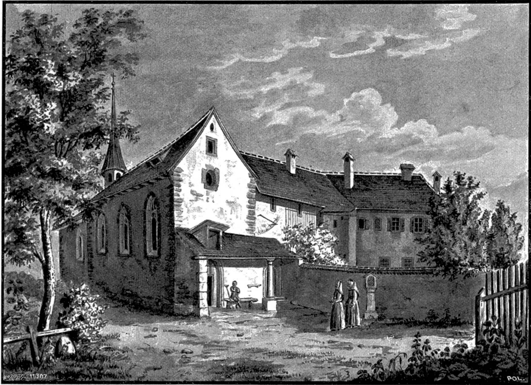
Kapuzinerkloster in Luzern. Sepiazeichnung von E. u. L. Schultheß (ca. 1850/54).

die Sterne am Himmel zählte oder leise Zwiegespräche mit den Hunden führte, sah oft das weiße Hemdchen Jankos, das sich an die Schenke heranschlich. Der Junge ging aber nicht hinein, sondern blieb draußen, duckte sich bei der Mauer und lauschte. Die Leute tanzten Obertas 1) , und mancher Bursche ließ von Zeit zu Zeit „U-ha!“ erschallen.