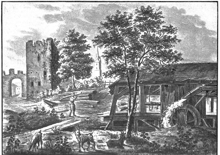
Herzenturm — ehemals Schloß des Grafen von Habsburg in Sempach. Sepiazeichnung von G. u. L. Schultheß (ca. 1850/54).

und eben das Spiel des Windes auf der Holzgabel belauschte . . . Sofort gürtete er den Riemen ab und verschaffte ihm ein gutes Denkzeichen. Doch was half dies? Die Leute nannten ihn: Janko, der Musikant! . . . Im Frühling, da konnte er ins Freie hinauslaufen, um sich an rauschenden Bache Hirtenflöten zu schnitzen. Bei Nacht, wenn die Frösche zu quaken, die Wachtelkönige auf den Wiesen zu schnalzen, die Rohrdommeln im Tau zu brummen ansingen, wenn die Hähne hinter den Zäunen krächten: dann konnte er nicht schlafen, sondern horchte nur, und horchte — und Gott allein mag's wissen, was für eine Musik er sogar hier heraus-