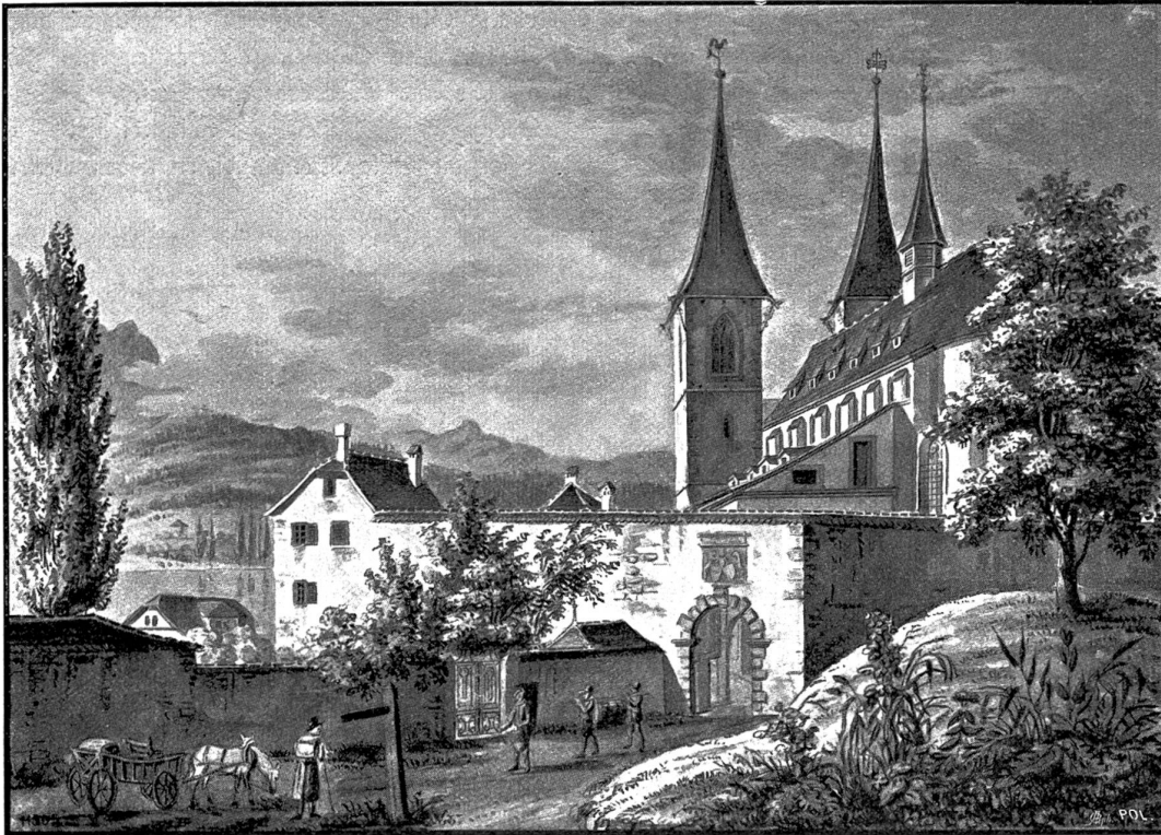
Hofkirche mit Zinggenthor in Luzern. Sepiazeichnung von G. u. L. Schultheß (ca. 1850/54).

Und die Mutter darauf: „Ich werde dir gleich was aufspielen! Wart' nur!“ Und nun machte sie oft Musik auf seinem Rücken mit dem Schaumlöffel. Der Junge schrie, versprach, niemals mehr auf die Stimmen zu hören, dachte aber doch fort daran, daß dort im Walde etwas gespielt hatte . . . Wer? — Wußte er's denn? . . . Die Tannen, Buchen, Birken, Pizrole — alles sang! . . . Der ganze Wald, und basta!