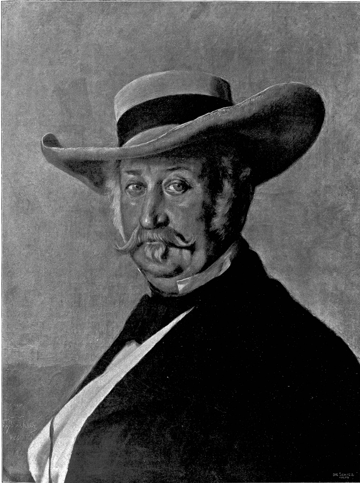
Major General John August Sutter (aus Rünenburg, Baselland).