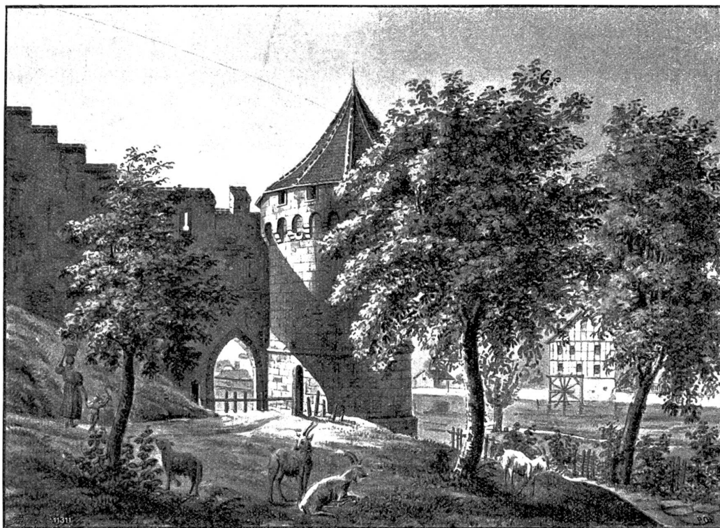
Möllithor an der Musegg. Sepiazzeichnung von G. u. L. Schultheß (ca. 1840).