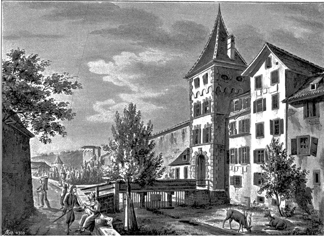
Bruchthor in Luzern. Sepiazeichnung von E. u. L. Schultheß (ca. 1840).