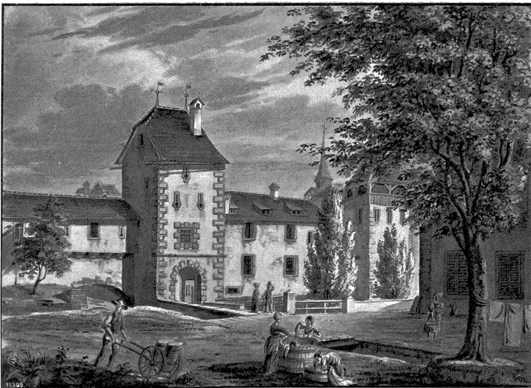
Oberes (Kriensers) Thor mit Franziskanerturm. Sepiazeichnung von E. u. L. Schultheß (ca. 1840).