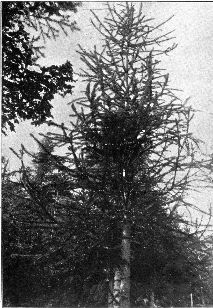
Fig. 1 Schlangentanne. Abies pectinata DC. lusus virgata Casp.

Bei einer zweiten Reihe von Spielarten ist nicht die Richtung, sondern die Zahl der Verzweigungen abnorm. Einen dürftigen Anblick bieten die verzweigungsarmen Formen, es sind förmliche Kümmerformen. Die „Schlangenfichte“ hat wenige, unregelmäßig verteilte, schlangenförmig gekrümmte Hauptäste, die sich wenig oder gar nicht verzweigen, dafür sind dann die Nadeln dieser Nester um so kräftiger. Ein solcher Zweig macht mit dem kräftigen Rotbraun der Rinde und dem dunkeln Grün der reichen Benadelung einen wunderschönen Eindruck. Auch bei der Weißtanne kommen ähnliche Formen vor (siehe Fig. 1 bis 3), die ebenfalls durch die prachtvoll ippige Entwicklung der Nadeln sich