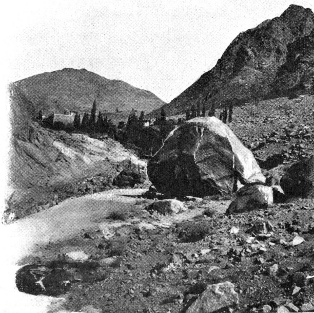
Das Kloster mit dem Klostergarten; im Hintergrunde der Djebel Munedja.

Schätze der Sinaibibliothek gewesen; durch sie wurde der weitere Ruin der Bibliothek aufgehalten, indem nun sowohl das gelehrte Abendland aufmerksamer nachforschte, als auch im Kloster selbst die Aufmerksamkeit erweckt wurde in Gestalt von Gewinnsucht, die in den alten Büchern wertvolle Kapitalien erblickte. In der That repräsentieren die vielen Manuskripte für das Kloster ein Depositum von wertvollen Obligationen, Aktien und Pfandscheinen, die eine occidentalische Bibliothek gerne bei hohem Kurs einzulösen würde. Einen wissenschaftlichen Wert besitzt die Bibliothek nicht für die Mönche, da sie keiner zu benutzen versteht. Der Bibliothekar, der jetzt gute Ordnung hält in der Bib-