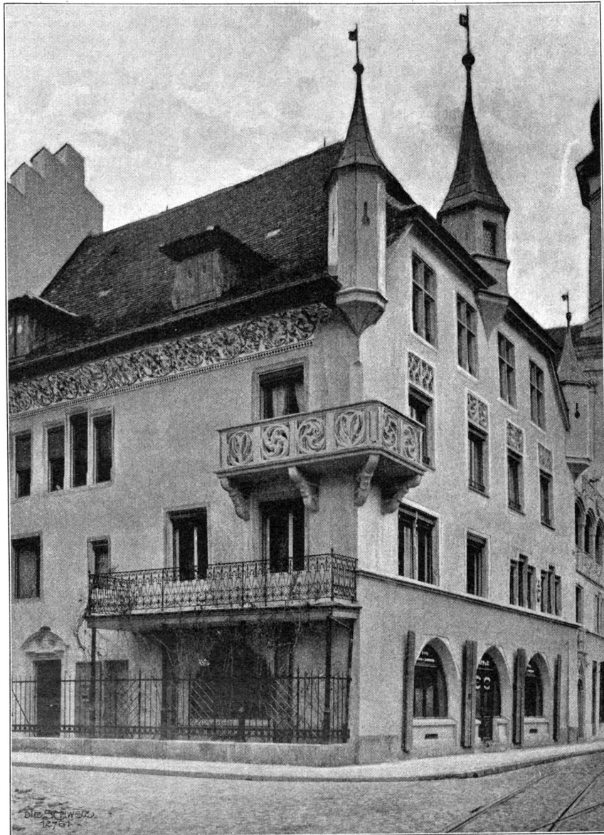
Der Freis Hof in Luzern (Vorderseite). (Siehe Seite 93).

„Ist er tot!“ unterbrach ihn Anne Marie und griff mit der Hand nach der Thüre zurück, um einen Halt zu finden.