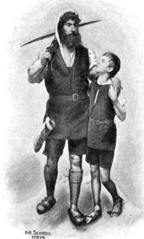
Tellgruppe aus der Tellaufführung in Brugg 1899.