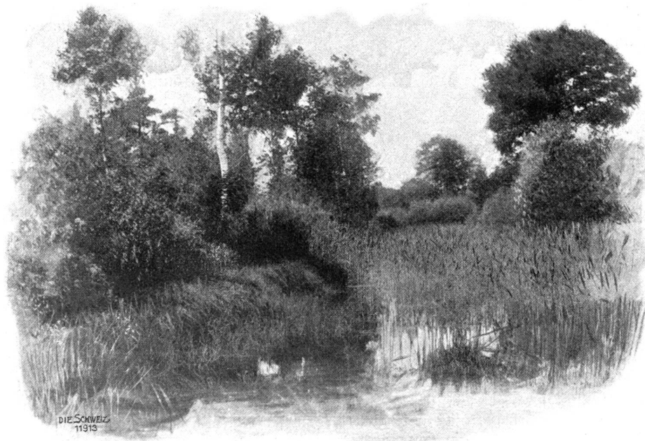
Studie aus dem Schachen bei Auenstein.

Wie dort gibt es auch hier Erfrischungen; noch etwas weiter, auf Stalden, einer alten Umspann-Station, finden große Gesellschaften Unterkunft. Aber man braucht eigentlich so weit nicht zu gehen: Der nahe Bruggerberg mit seinen sich gemach am Hügel hinwindenden Schattentwegen, die da und dort in behagliche Fest- und Fernsichtsplätze einmünden (Nieteid, Heyenplatz, Hansfluh, Bruderhaus — wo die Brugger ihre Kindlein herholen —, Kegelplatz etc.) gestattet neben schönen Spaziergängen im einsamen Sidwald schon einen ganz prächtigen Ausblick in die Alpen, der im Vordergrund links vom Gebenstorfer Horn mit dem von grüner Terrasse aufragenden, hellleuchtenden Kirchen-Geschwisterpaar und rechts vom Wülpels- und Steftenberg mit den Schlössern Habsburg und Brunegg flankiert wird; zudem hat man eine Thallandschaft von eigenartigem Reiz vor sich: Links in der Tiefe das industrielle Windisch, dessen Baumwollspinnereien gegen zweitausend Hände beschäftigten, zu Füßen das idyllische Städtchen, dessen älterem Teil ein gewisser romantischer Charakter nicht abzuspüren ist. Auf der breiten Thalsohle zwischen dem Wülpelsberg mit der Ruine Habsburg einer- und dem Bögberg anderseits wälzt von Westen her in kräftigen Bindungen die Aare ihre weißglänzenden Wogen, die grünen Tannen-