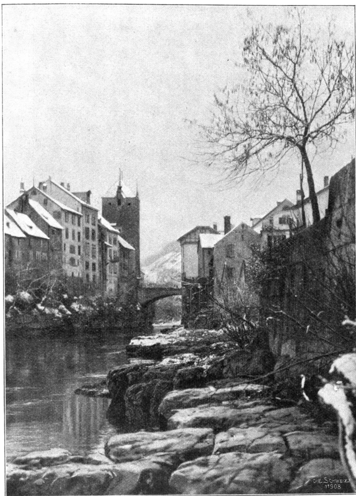
Brugg: Partie an der Aare.