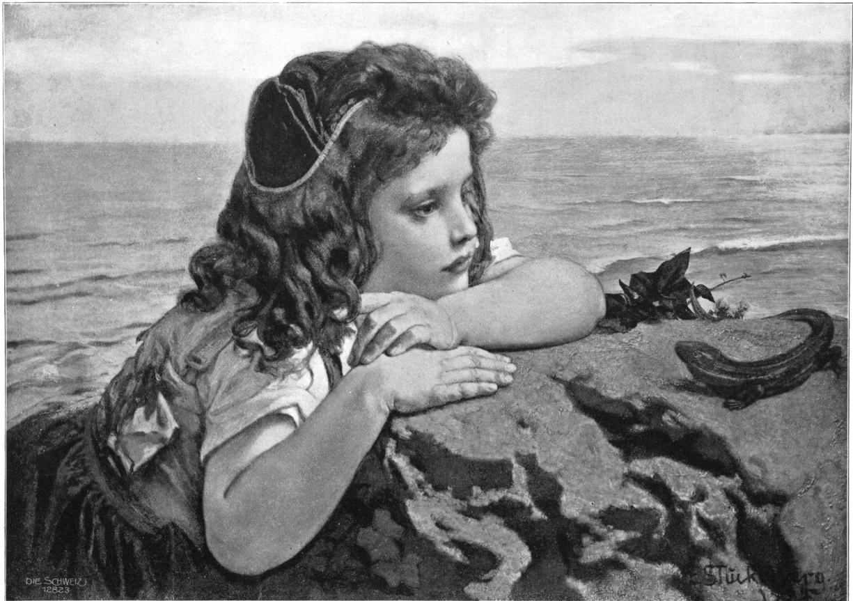
Kind mit Eidechse. Gemälde von Ernst Stückelberg, Basel. Im Besitze von Frau Oberst Merian-Helin in Basel.