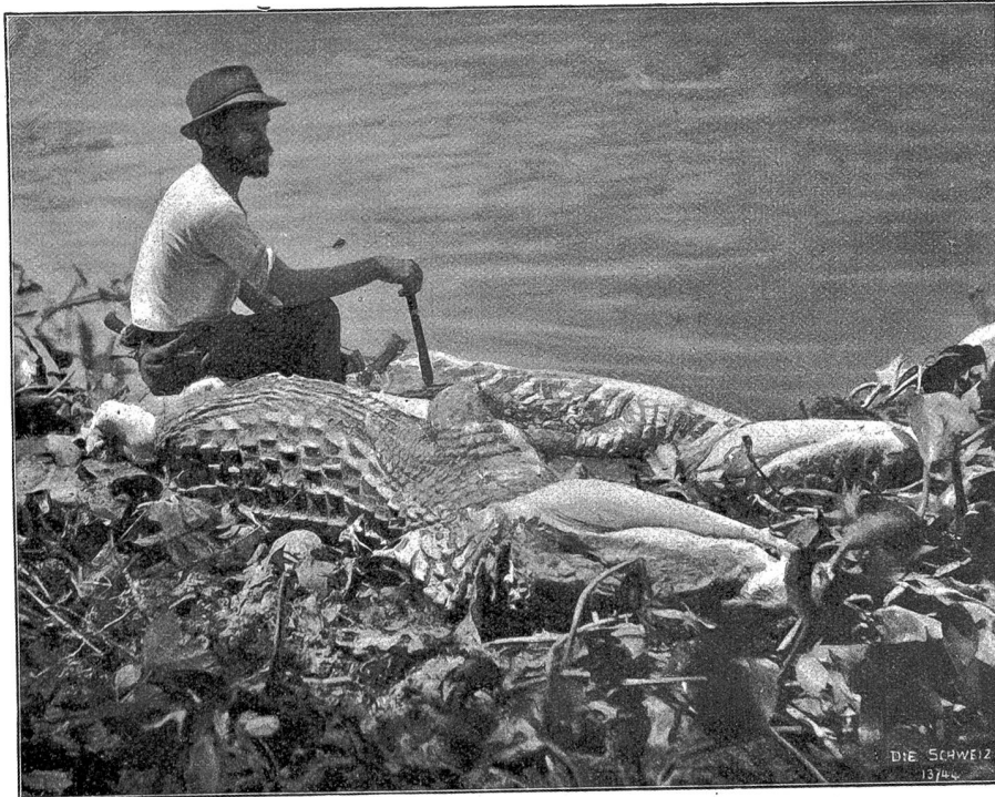
Alligatoren-Schlachten im Amazonasstrom. Abb. 4. Zwei Niesen aus dem Lago Affahy von der beträchtlichen Körperlänge von 4,2 m.

Der Lago Affahy liegt östlich vom Lago Acauá am Rande des Urwaldsaumes, der die ganze Insel längs der Küste einnimmt. Vom Lago Affahy aus geht nach der Küste ein kleiner Fluß, der Igarapé Jacaré, während nach dem Zentrum der Insel mehrere Mondongos-Arme in den Campo eingreifen, der hier auf endlose Strecken hin mit Papyrus (Piri) bedeckt ist und einen sogenannten Pirisal bildet. Wie im Lago Acauá ziehen sich auch hier die Jacarés beim Austrocknen des Sumpfes in den See zurück. Der See selbst ist zum größten Teil von Eichhornia, eine an der Oberfläche schwimmende Pflanze, bedeckt, die den Wasserspiegel an vielen Stellen so dicht überwuchert, daß das Ganze weit eher einer grünen Wiese, als einem See gleicht. Wegen seines ungeheuren Fischreichtums bildet der See ein wahres Paradies für die Alligatoren.