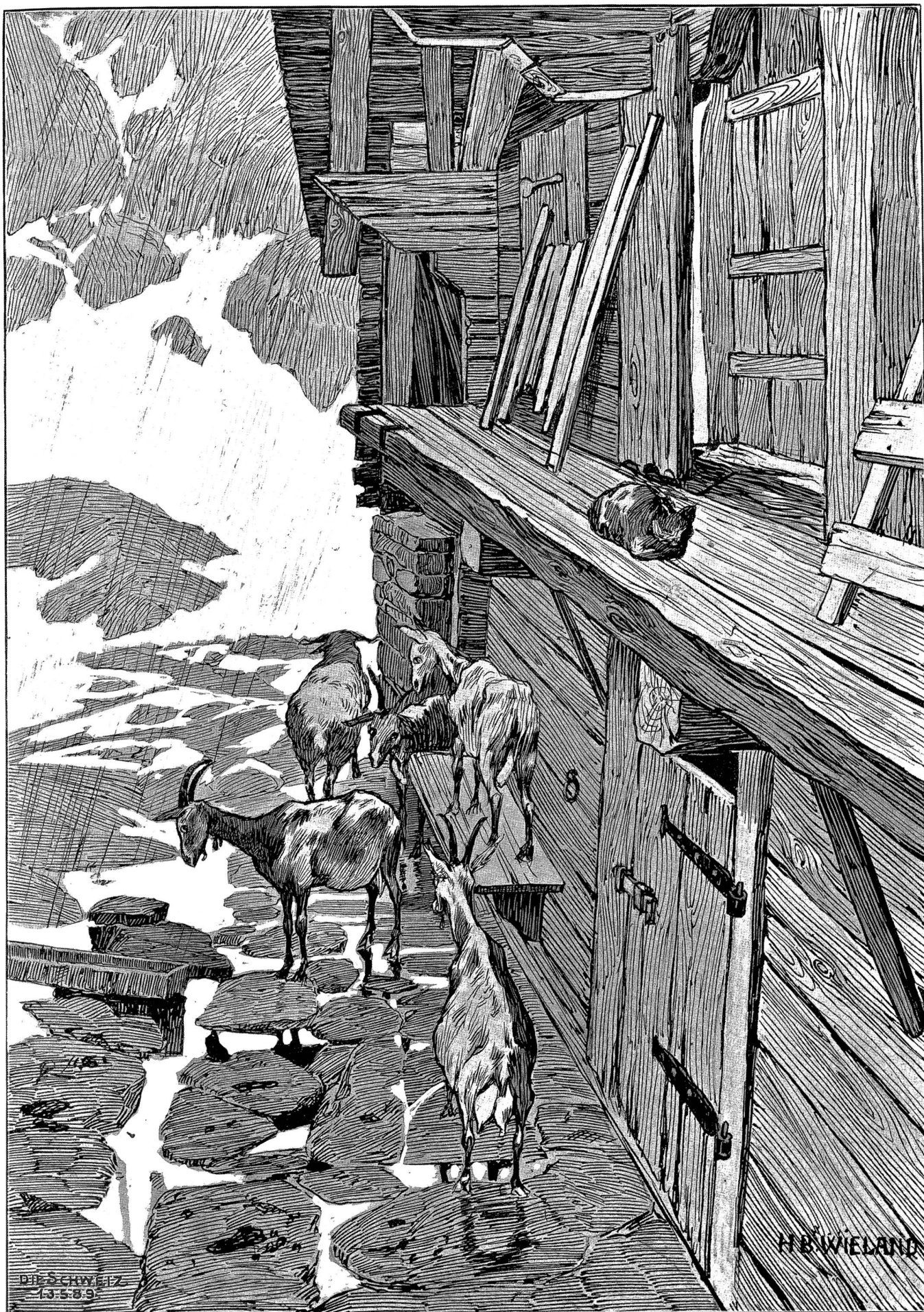
Ziegenstall im Regen. Skizze von H. E. Wieland, München.