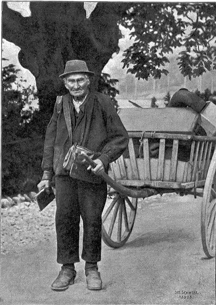
DIE SCHWEIZ. 19305.

Gerlinde zuckte zusammen; ein jähes Erschrecken malte sich auf ihren Zügen, ihre Wangen, die sich vorhin bei Feldern's Lob leise gerötet hatten, waren jetzt wieder so weiß wie das Kleid, das sie trug, und sie pries es als ein wahrhaftiges Glück, das Brautpaar hinter sich zu wissen. So blickte sie weder zeitwärts, noch rückwärts, als ob sie von dem ganzen, unerquicklichen Gespräch nichts vernommen hätte; Feldern aber sah seine Braut an. Es war ein langer, verwunderter Blick, der ihr die Röte der Scham in das Gesicht trieb; allein dieser Blick gab Angela die an diesem Tag schon zum zweiten Mal verlorene Selbstbeherrschung zurück. Sie sah ein, daß sie zu weit gegangen; aber sie baute auf ihre Schönheit, deren Macht sie ja erst vor wenig mehr denn einer Stunde wieder einmal erprobt hatte. Auch diesmal mußte es ihr ein Leichtes sein, Erich zu verfühnen.