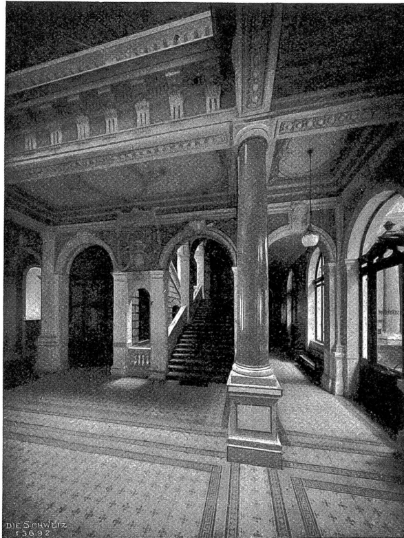
Zürcher Kantonalbank: Vestibül (Blick nach Süden).

Der Bau hat immer seinen ungehörten Fortgang genommen. Am 17. Februar dieses Jahres nahmen der Kantonsrat und Regierungsrat eine Besichtigung vor und vereinigten sich nachher auf Einladung des Bankrats zu einem einfachen Mahl auf der Schmidstube. Die bei diesem Anlaß gehaltenen