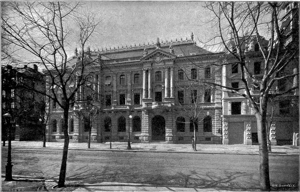
Die Zürcher Kantonalbank.