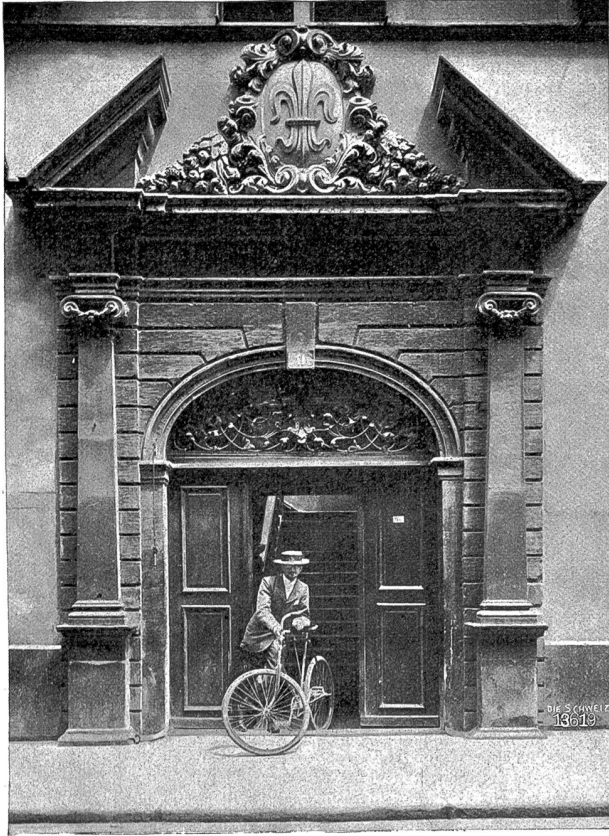
Eingangportal des alten Zunfthauses, erstellt 1701.

— Geschenke dieser Korporationen — tragen. Auch in diesem großen Saal sind ein Treppenwerk am einen, ein reicher gotischer Kamin am andern Ende willkommene Unterbrechungen der hier natur- und zweckgemäß größeren ebenen Bodenfläche. Bei sämtlichen dekorativen Arbeiten hat dem leitenden Architekten der Maler Franz Baur mit seinem Geschmack und seiner Geschicklichkeit in Ueberlegung und Ausführung des Gewünschten hülffreich zur Seite gestanden. Die beiden Stirnwände des großen Saals sind mit Gemälden von Emil