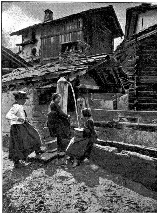
Am Dorfbrunnen zu Evolena.

Die Thäler des Arolla- und des Ferpèclegletschers, die bei Haudère zusammenlaufen, waren noch in dümmriges Dunkel gehüllt; doch verschwammen die Sternbilder auf dem sich hellenden Himmelsgewölbe. Nun kommt mir auch gleich in den Sinn, was mir das tote Mütterchen über die Entstehung von Haudère erzählt hatte. Vor zwei Jahrhunderten lebte in