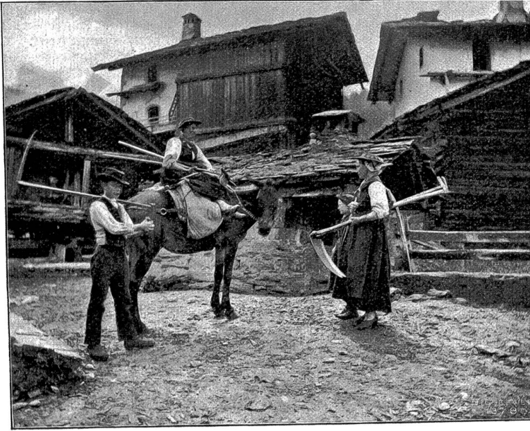
Bauernfamilie von Evolena.

Lütte, dem Mahen von Haubère, eine alte Frau mit ihren drei Söhnen. Als in einem überaus strengen Winter der Schnee schon drei Meter hoch vor dem Haus lag und die Flocken immer noch dichter fielen, begien die Söhne Beforgnis, die Lawinen könnten das Haus verschütten. „Geht nur ruhig schlafen,“ sagte die Mutter; „das Haus steht seit drei Jahrhunderten da und wird diese Nacht wohl noch aushalten.“ Die Söhne gingen ins Heubett, die Mutter blieb wach und betete. In der Nacht stürzte die Lawine und schob das Haus vor sich her bis ans Ufer der Borgne, wo es jetzt noch steht. Die Hausbewohner waren spurlos verschwunden bis auf einen der Söhne, den man in fein Leintuch eingewickelt noch am Leben fand. Er wurde der Stammvater der Bewohner von Haubère, wo das Leintuch zum Andenken an den wunderbaren Vorgang heute noch aufbewahrt bleibt.