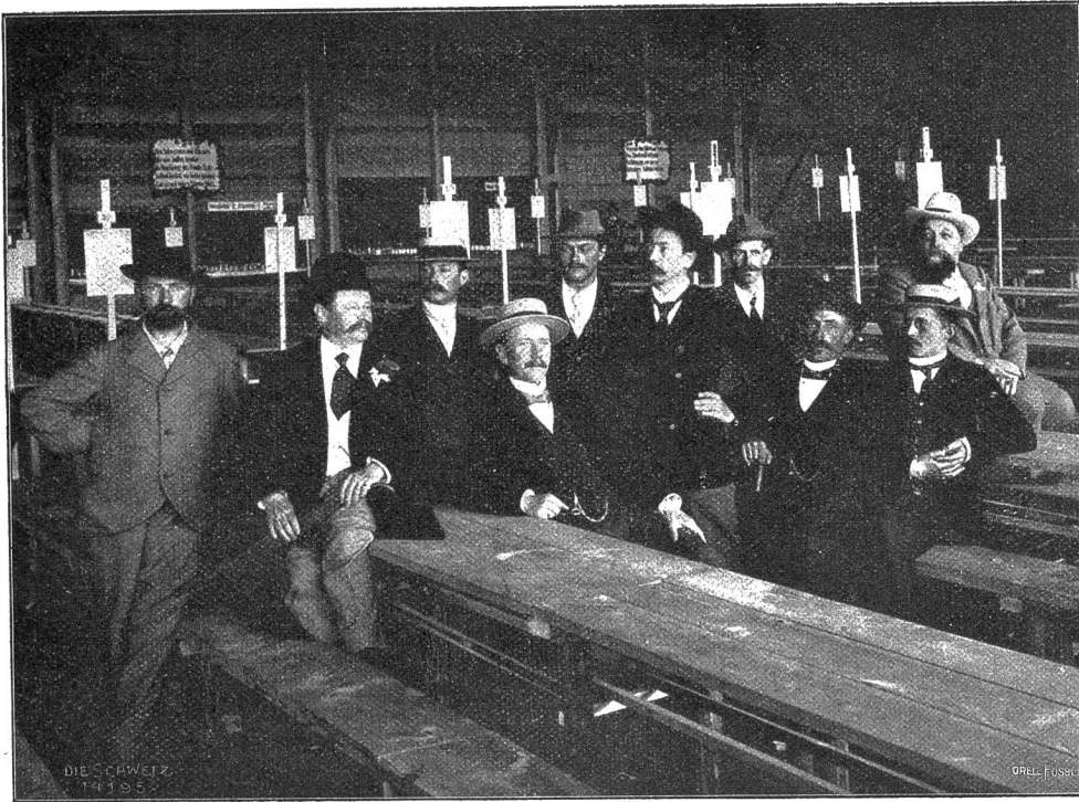
Bildhauer Otto Steiger.