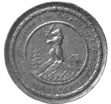
Rückseite der Appenzeller Denkmünze mit Wappen von Speicher.