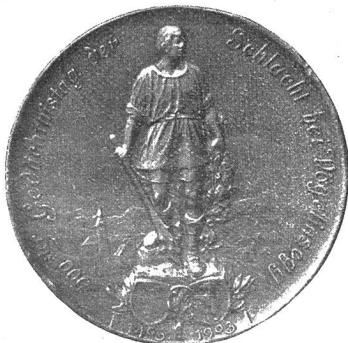
Appenzeller Denkmünze, entworfen von Kaufmann, Luzern.