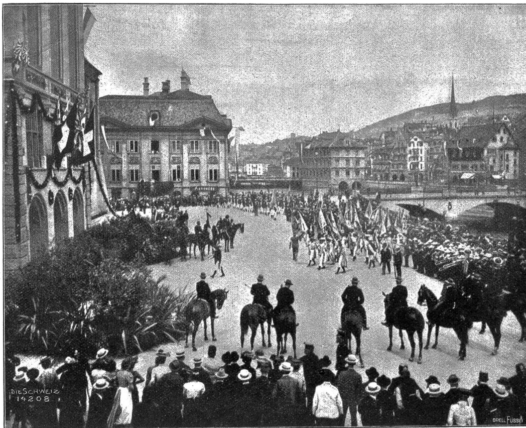
Vom eidgenössischen Turnfest in Zürich: Einzug der eidgenössischen Fahne ins Stadthaus.

Denn so konnte es nicht weiter gehen: die Ge-