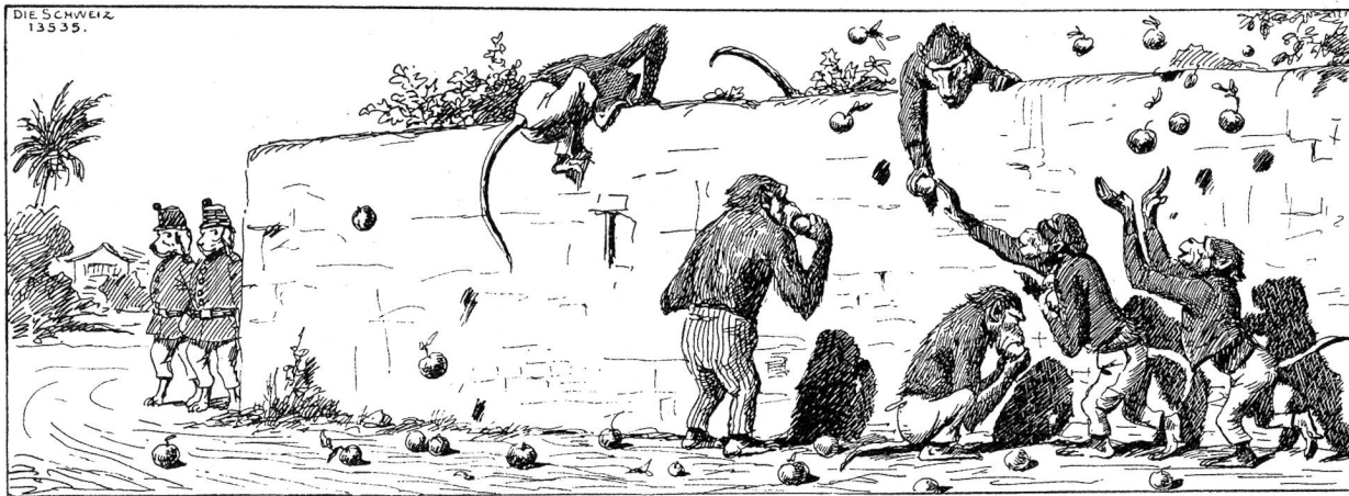
Hepfeldiebe I. Kopfsleife von Evert van Muiden.