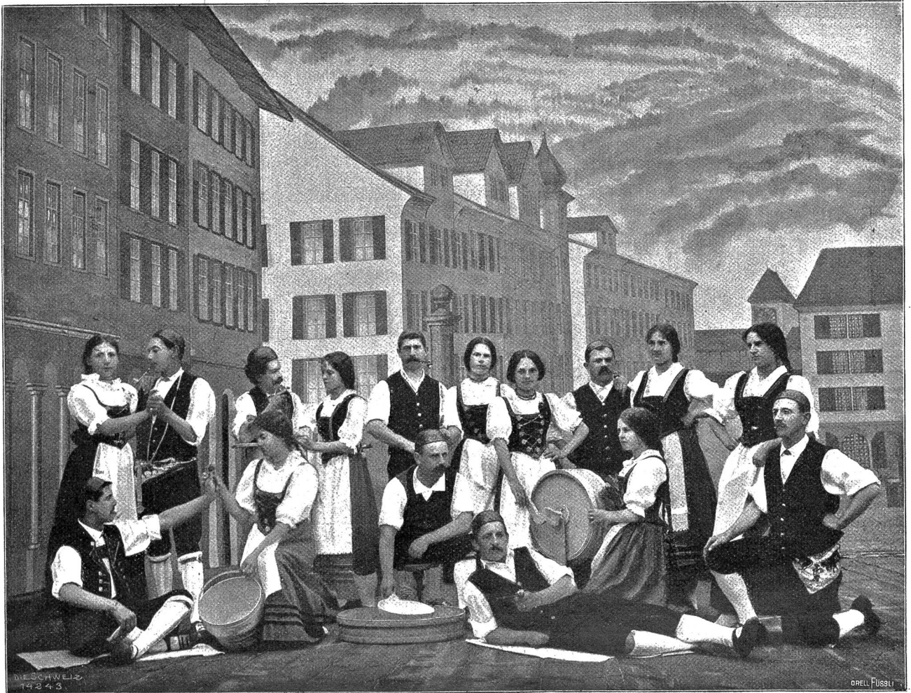
Toggenburger Jahrhundertfeier in Lichtensteig. Sennengruppe aus der Szene „Marktleben“.

würde: wie wollte er tief aufatmen! Denn erst dann war die Phantastie in Wirklichkeit getreten, und mit jeder Sekunde wurde sie greifbarer und wahrer.