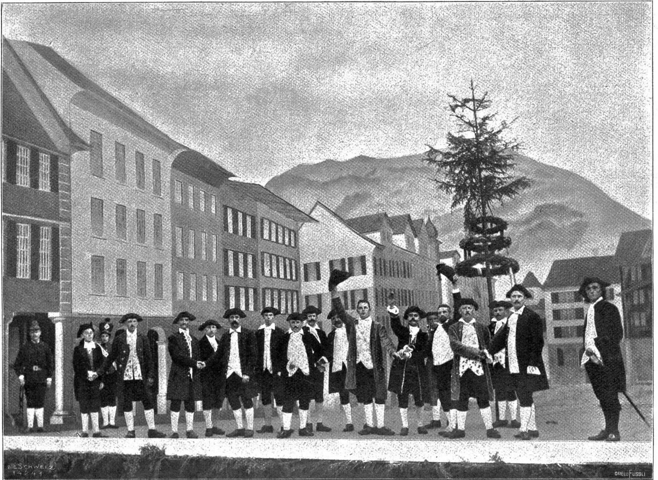
Toggenburger Jahrhundertfeier in Nichtensteig. Der Landrat des Toggenburg und der Stadtrat von Nichtensteig begrüßen die Befreiung der Landschaft (Freiheitsbaum).