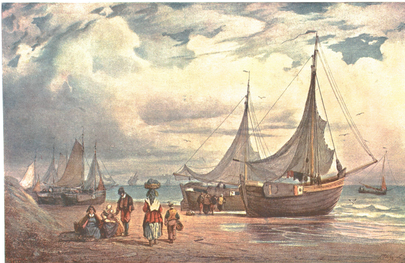
Strandbild (Bei Scheveningen an der Nordsee). Nach dem Aquarell von † Joh. Jakob Ulrich (1852). Original in der Kupferstichsammlung der Polytechnischen Schule.