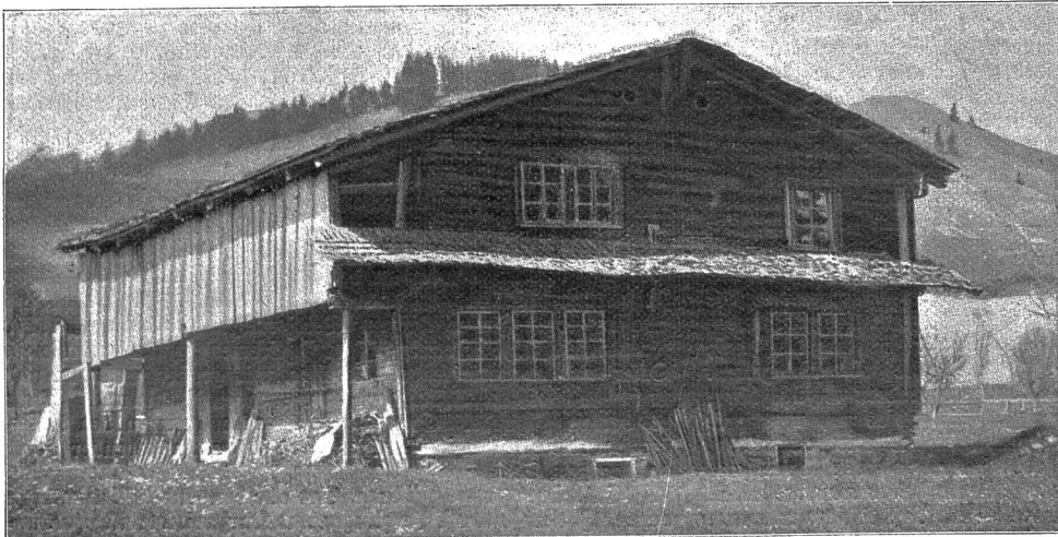
Christian Schybis Geburtshaus in Escholzmatt im Entlebuch (vor kurzem erst abgebrochen).

Das Beispiel der Berner*) hat die Luzerner Bevölkerung angefeuert, auch ihren Helden aus dem großen Bauernkrieg ein Denkmal zu setzen. Am 26. Juli wurde es zu Escholzmatt im Entlebuch eingeweiht. Auf private Initiative hin waren zu diesem Zweck die nötigen Geldmittel gesammelt worden. Das Denkmal besteht aus einem mächtigen, 350 Zentner schweren Findling, der nach Escholzmatt transportiert und auf dem Gemeindeplatz aufgestellt wurde. Er ist geschmückt mit den in Erz gegossenen,