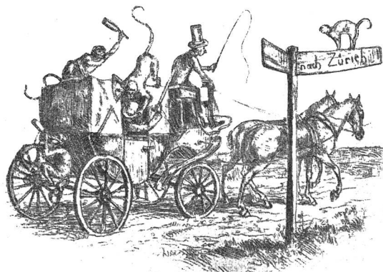
Zur Ausfahrt der Mittwoch-Höflich-Gesellschaft nach Wohlen. Nach der Radierung von Albert Welti.

„Nun,“ sagt er mit gezwungener Ruhe, immer noch auf die Nachricht starrend, „das ist wenigstens deutlich und läßt kein Mißverständnis aufkommen.“