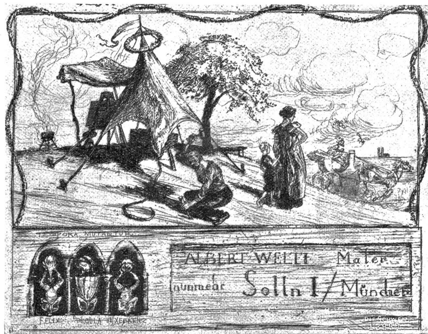
Postkartengruß des Künstlers aus Solln I bei München (Sommer 1901).

Der König stützte das Haupt in die Hand und schaute die beiden Männer abwechselnd mit lachenden Blicken an. „Also glaubenslos — beide!“ sagte er fein. „Wollt kalt berechnender Vernunft! Schüler griechischer Weltweisheit! Und sitzen nachts beisammen und träumen mit offenen Augen — von der Seele eines Weibes! Wie folgerichtig! Gab Allah wirklich Verstand allen denen, so er Glauben versagt hat? Oder aber — — Ibn Chaldun, jetzt brenne ich wirklich vor Begierde,