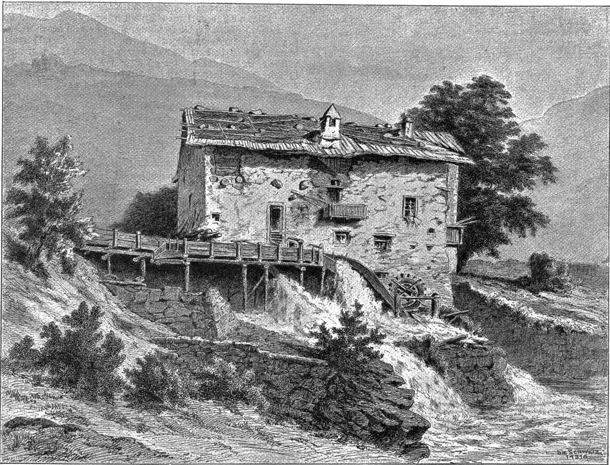
Premadio bei Vormio (Veltlin). Nach Federzeichnung (1. Sept. 1901) von Emilie Escher-Kündig, Zürich.

Die Konsultation der beiden Ärzte nahm nur wenig Zeit in Anspruch. Ihr Urteil lautete übereinstimmend: „Ihr müßt Euch in den Kantons-Spital überführen lassen, lieber Mann!“