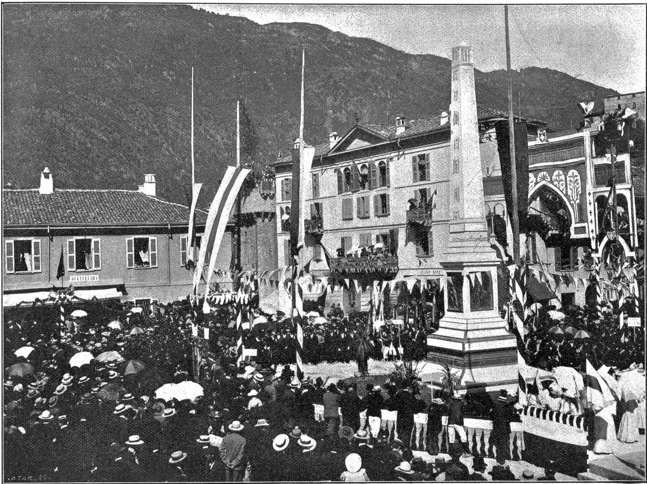
Von der Tessiner Jahrhundertfeier in Bellinzona: Einweihung des Freiheitsdenkmals auf dem St. Rochusplatz am 10. Sept. 1903.

Vertreter der eidgenössischen und kantonalen Behörden und eine vieltausendköpfige Menge wohnten der erhebenden Feier bei. — Daran schloß sich ein hübsch arrangierter Umzug. Zwei der schönsten Gruppen führen wir unsern Lesern vor. Besonders die eine, die „Blumenkönigin“ verriet in ihrem Arrangement einen so feinen Geschmack und eine solche Virtuosität in der Verwendung von Blumen als Dekoration, daß dieser Wagen dem elegantesten Blumenkorso Nizzas alle Ehre gemacht hätte.