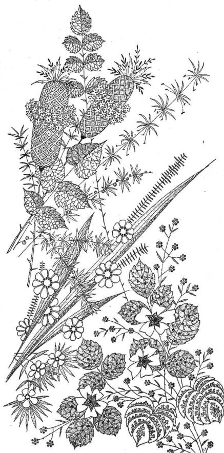
Probe aus F. Vänzigers frühern Werken.