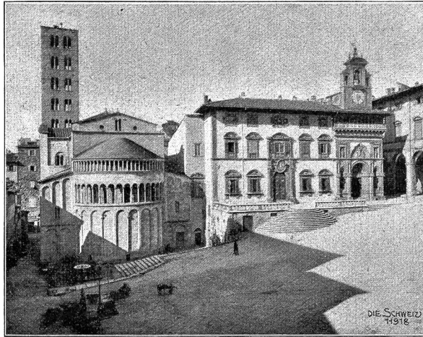
Arezzo Abb. 1: Piazza Vasari.