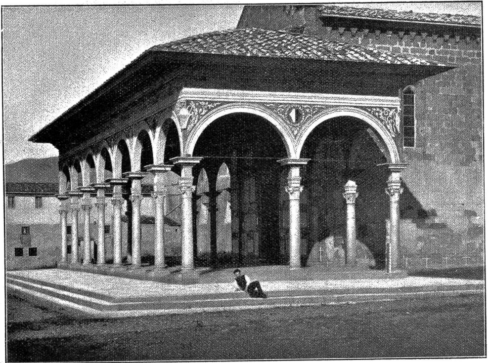
Arezzo Abb. 4: Vorhalle von Santa Maria delle Grazie.

Als die haberdenden Brüder den Schlußstein fügten, berührten sich zufällig ihre Hände. Sie standen Brust an Brust; das Herz schlug ihnen höher, teils vor Freude über die vollendete Steinbildung und teils unter einer aufwallenden Empfindung der alten Liebe. Und weil sich bei einem gleichzeitigen Vorbeugen ihre Stirnen berührten, konnten sie nicht anders als sich ansehen, einmal mit einem scheuen Streifblick, und noch einmal mit einem verwunderten Erwaschen in den Augen. Und zum dritten Mal sahen sie einander offen und klar in das Antlitz, daß die Sonnenblitze von Seele zu Seele zuckten und die verschüchterten Liebesfeuer wieder hell aufzuflammen begannen. Und mit dem alten treuen