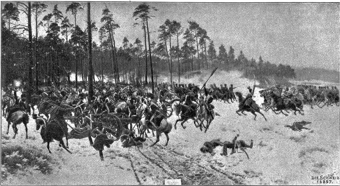
Polenmuseum zu Rapperswil. Sieg der Polen unter Dwernicki in der Schlacht bei Stoczec (14. II. 1831). Gemälde von Rosen.

hunderttausend Unterschriften tragen soll. Mit wehmütigem Empfinden wird ferner auch der Nichtpole die zahlreichen künstlerischen Arbeiten und Darstellungen betrachten, die von polnischen Verbannten in Sibirien angefertigt wurden und die auf meist recht abenteuerlichen Wegen an ihren Bestimmungsort gelangten. Es sind wahre Kabinettstücke von Geduldsarbeiten darunter, die mit den primitiven Hilfsmitteln viele Jahre zu ihrer Herstellung erforderten. Und meist ist mit diesen Gegenständen ein hochklingender, einst angesehen Name verbunden.