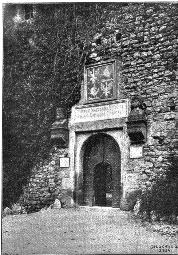
Eingang zum Polenmuseum. Ueber dem Tor die Büsten von Kasimir III. d. Gr. und Jadwiga.