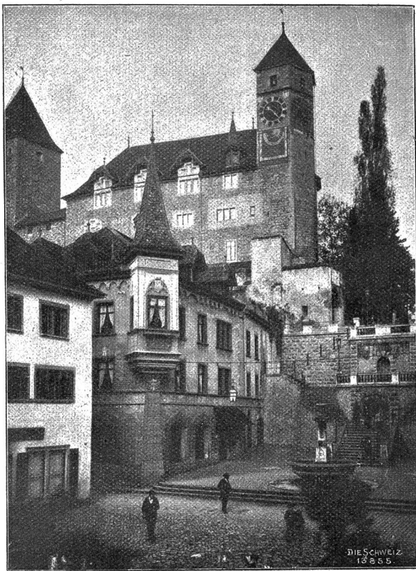
Schloss Rapperswil am Zürichsee, 1869 von Graf Plater zu einem polnischen Nationalmuseum eingerichtet.

weis der mächtigen Entwicklung, die die Hauptstadt genommen, und in Folge der Erbauung des bakteriologischen Institutes steht sie gegenwärtig auch in gleicher Höhe mit allen andern wissenschaftlichen Zentren Europas.