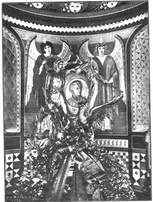
Mausoleum im Polenmuseum mit dem Herz Kosciuszko's (seit 1895).

1870 konnte die Gröföffnung dieses eigenartigen Museums stattfinden. Eigenartig wegen seines Inhalts und eigenartig auch, weil es weit entfernt ist von dem Land und dem Volk, das es schildert. Von den reichen Schätzen, die es birgt und die durch Vermächtnisse und Schenkungen immer noch Vermehrung finden, seien nur erwähnt die reichhaltige Gemädegalerie mit Werken berühmter polnischer und fremder Meister, eine Sammlung wundervoller Rameen mit Darstellung von großen Personen und Ereignissen aus Polens Geschichte und die Sammlung von Kostümen, Uniformen und Waffen aller Zeiten, ferner Münzen, Medaillen und kunstvolle nationale Erzeugnisse, sodann die wertvolle Bibliothek mit über siebzigtausend Bänden und fünfhundert Manuskripten, in der auch alle auf der Welt erscheinenden polnischen Zeitungen und Zeitschriften gesammelt werden. Den in großer Anzahl vorhandenen Erinnerungen an den Revolutionshelden Kosciuszko, den Dichter Adam Mickiewicz, der 1839/40 an der Akademie von Lauranne gelehrt hat, und an den Astronomen Nikolaus