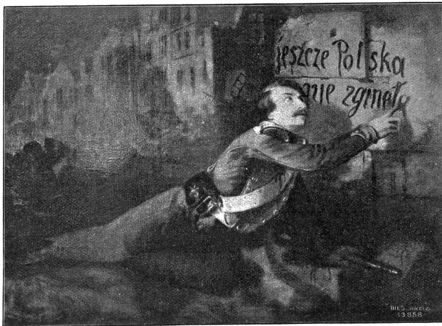
Polenmuseum zu Rapperswil. „Noch ist Polen nicht verloren!“ schreibt ein sterbender polnischer Nationalgardist mit seinem Blut an die Mauer (Warschauer Gememel 1831). Gemälde von Guifbert

Natürlich werden Sie denken, daß dies das Ende meiner Geschichte sei; doch da täuschen Sie sich. Sechs Monate später, als ich zu Hause in meiner Studierstube saß, brachte mir ein Diener eine Karte. Sie trug den Namen: J. Manderison Brown. Ich erschrak tatsächlich. Der Mann hatte mich gefunden.