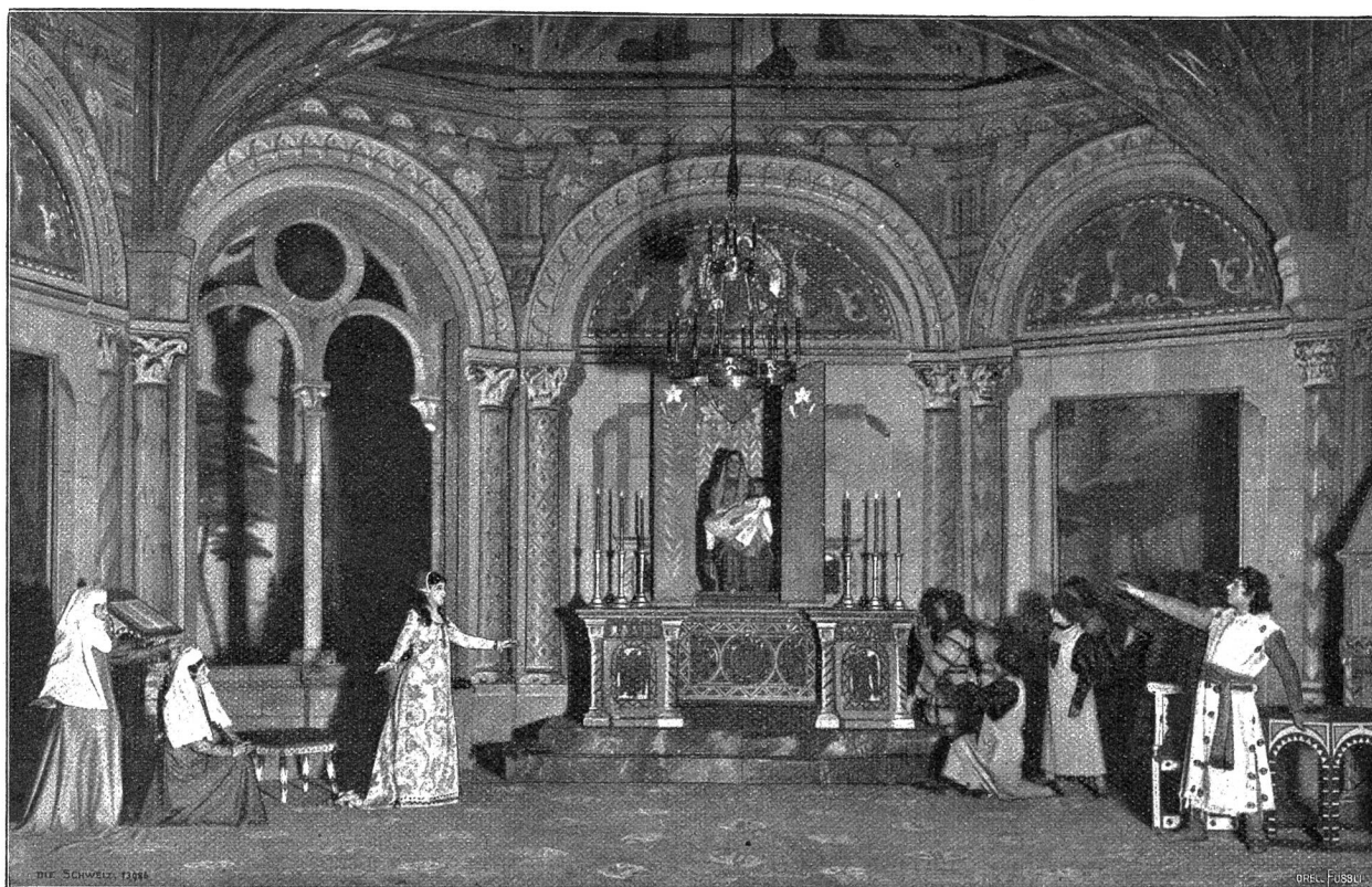
Griselidis (III. Akt, VII. Szene). Griseldis erhält von der heiligen Agnes ihr geraubtes Kind zurück.

ponist der französischen „Manon“, der „Sappho“ und „Navarraise“ ebenso glücklich in der Schaffung einer reizvollen französischen „Griselidis“ sein werde. Die Ausführung rechtfertigte diese Anschauung.