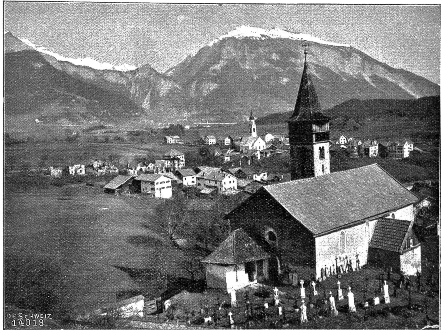
Rhäzüns im Domleschg. Im Vordergrund die alte St. Georgenkapelle mit Fresken a. d. 14. Jahrhundert.

falls das ganze Dorf verloren gewesen. Der junge Tag fand das Zerstörungswerk bereits vollendet, und die aufgehende Sonne beleuchtete eine traurige Szene. Der ganze oberhalb der Kirche gelegene Teil des Dorfes bildete nurmehr einen rauchenden Trümmerhaufen, aus dem bloß noch einige Mauern aufragten; Männer, Frauen und Kinder umstanden jammernd und wehklagend das Grab ihrer Habe. Es sind dreiundzwanzig Familien mit über hundert Angehörigen obdachlos geworden, und die wenigsten haben auch nur das Notwendigste zur Bekleidung des eigenen Körpers gerettet. Hier wäre Hilfe dringend nötig; denn der durch die Versicherung ungedeckte Schaden betrifft gerade die Ärmsten. Leider hat das Unglück auch zwei junge Menschenleben gefordert. Zwei Kinder im Alter von \frac{1}{2} und zwei Jahren sind im Feuer geblieben, während die Eltern aus dem zweiten Stockwerk ins Freie sprangen und schwer verletzt vom Platz getragen werden mußten. — Leider scheint es, daß auch diesmal die Frevlerhand, die das Unglück verschuldete, unentdeckt bleiben soll, die angehobene Untersuchung ergab bisher kein Resultat.