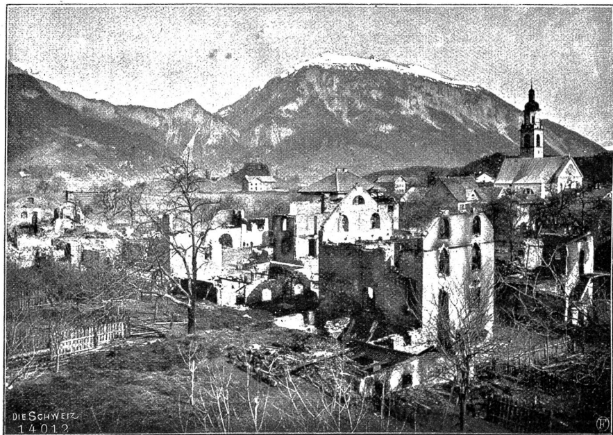
Rhäzüns im Domleschg. Brandstätte.