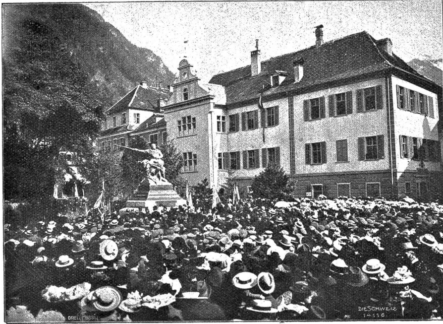
Einweihung des Fontanadenkmals in Chur.

„Ist's ein Pfarrer?“ fragt Frau Mansel mit ihrer tiefen, weichen Stimme.